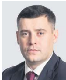
Григорий АРТАМОНОВ, глава Городского округа Подольск

Уважаемые подольчане! Сегодня, в День защитника Отечества, мы чествуем тех, кто посвятил себя служению Родине!