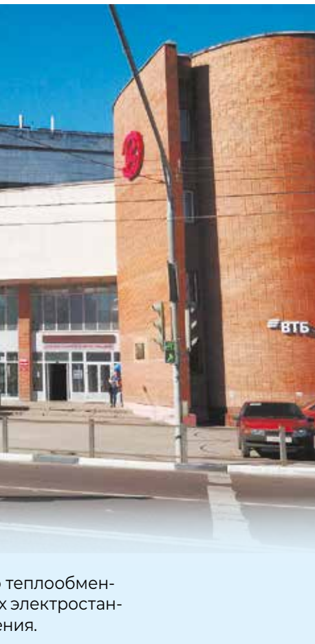
теплообмен- х электростан- ция.

ки- АО пр- иО» ге- ом: где ие. ии т- ск». ише ий- ск» ии ри- ле- ной ак- для ер- до- ти- рь» ого но- тво