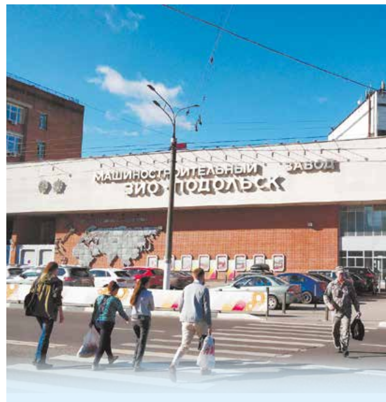
ЗиО-Подольск – крупнейший производитель высокосложного оборудования для предприятий ТЭК: атомных и тепловых станций, нефтяной и газовой промышленности, а также судостроения

Сегодня ПАО «Машиностроительный завод «ЗиО-Подольск» – флагман российской индустрии,