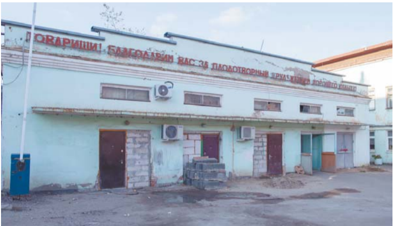
Следы запустения видны по всей территории предприятия

Вопрос четвёртый. Ожидать ли подолчанам и в этот отопительный сезон прекращения подачи горячей воды и теплоснабжения? Устранены ли причины и условия, способствовавшие возникновению этой чрезвычайной ситуации в недавнем прошлом?