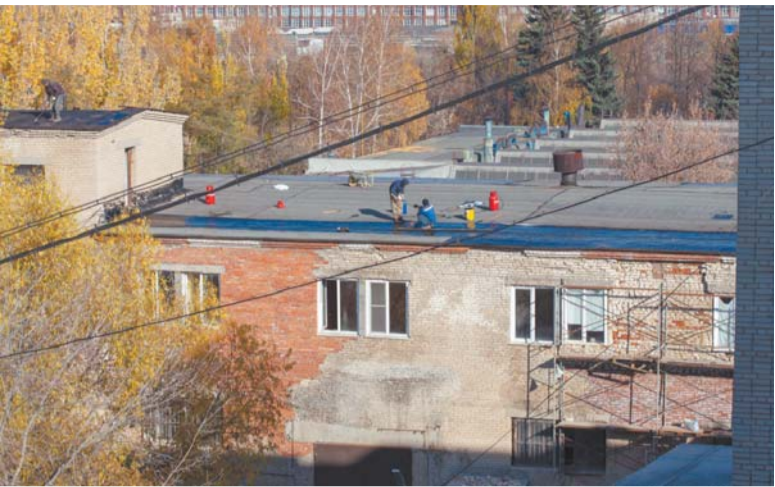
Ведётся ремонт зданий, понемногу улучшаются условия труда

Всё оборудование АО «ПЭМЗ» работает в штатном режиме, единственная