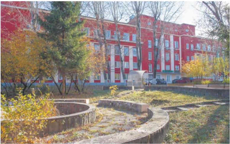
Многие здания завода сданы в аренду

Разворовать и «пустить под откос» или спасти и возродить?