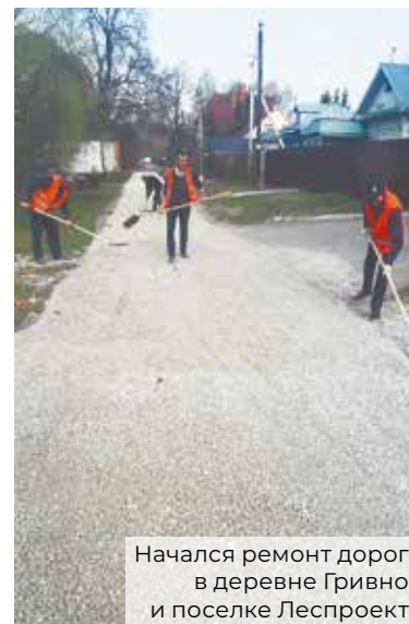
Начался ремонт дорог в деревне Гривно и поселке Леспроект

– У нас делали ремонт на улицах Юбилейной-1 и 2. На мой взгляд, работы выполнялись организованно, особых неудобств не вызвали.