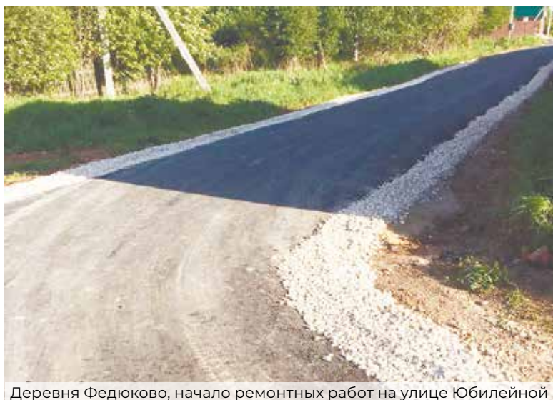
Деревня Федюково, начало ремонтных работ на улице Юбилейной