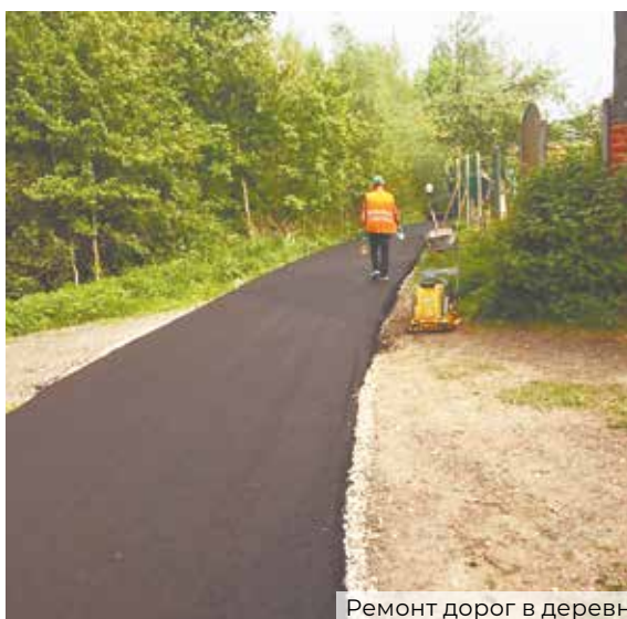
Ремонт дорог в деревнях Федюково и Борисовка