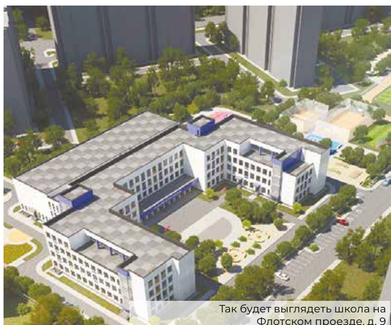
Так будет выглядеть школа на Флотском проезде, д. 9