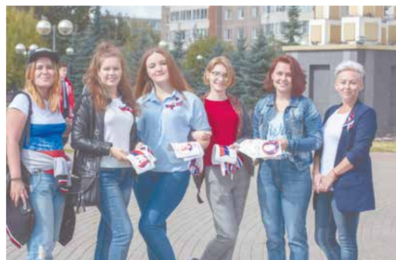
Каждый год в этот день организуются пропагандистские акции, проводятся культурно-массовые и спортивные мероприятия для детей и взрослых, флешмобы

В Большом Подольске отметили День Государственного флага России