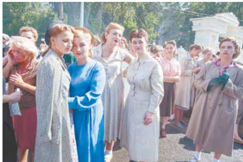
снимался дубль за дублем... Самое большое количество подольчан пришло на съёмки в последний день — 312 человек.

Всего за пять дней в съёмках массовых сцен в Подольске приняли участие около 500 подольчан. Кто-то отработал по одной смене, а кто-то выдержал все пять. Но впервые режиссерская группа картины отметила невероятное единство всех участников процесса, когда дублей почти не требовалось, когда на одном дыхании