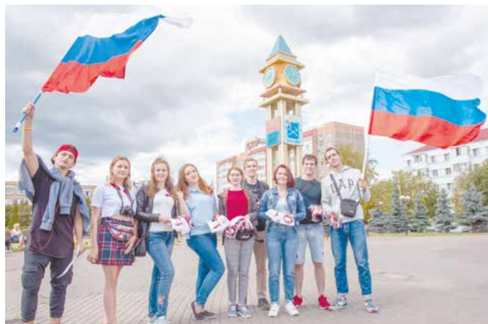
Ребята поделились, что гордятся нашей страной, любят её и очень рады, что смогли почувствовать себя частью великой державы