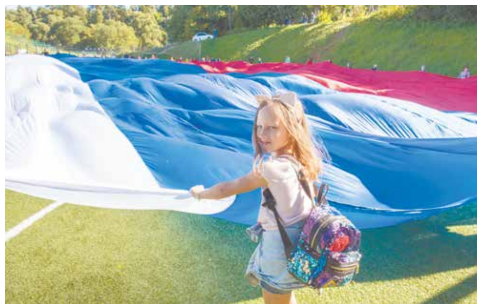
Дети – именно та аудитория, которой это необходимо больше всего: им беречь нашу страну, развивать её в будущем.

■ Учредитель – Муниципальное автономное учреждение «Медиацентр» ■ Адрес редакции: 142 184, Московская обл., г. Подольск, мкр. «Климовск», ул. Революции, 6. +7 (4967) 69-07-43 ■ Издатель – МАУ «Медиацентр», 142 184, Московская обл., г. Подольск, мкр. «Климовск», ул. Революции, 6. ■ Главный редактор – В.В. Гончаров ■ Компьютерная верстка – Е.А. Прохорова ■ Фотокорреспонденты – К.С. Шутилин, В.А. Лычагин