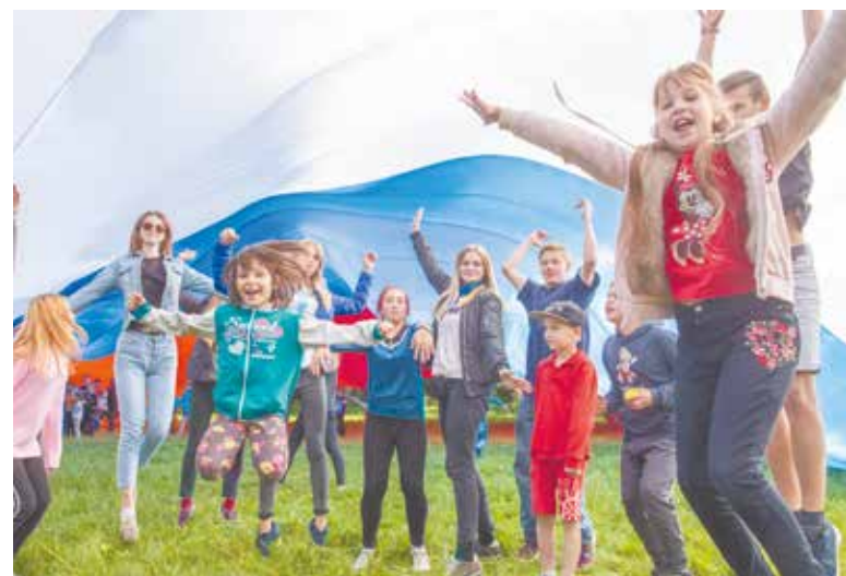
У детей от праздника остались хорошие и яркие впечатления