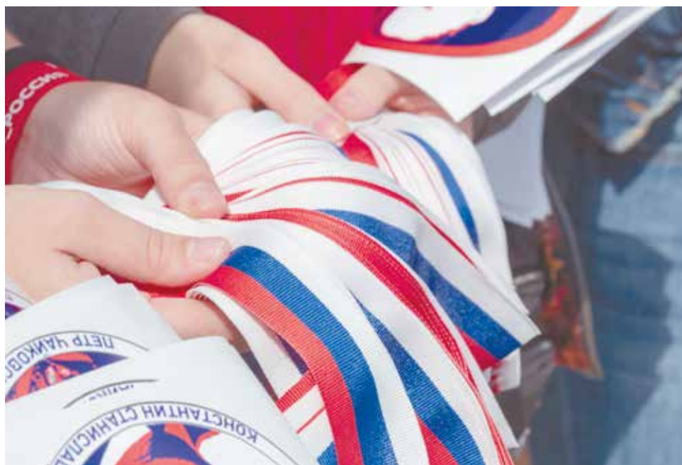
Молодёжь и волонтеры раздавали ленточки цветов российского триколора.