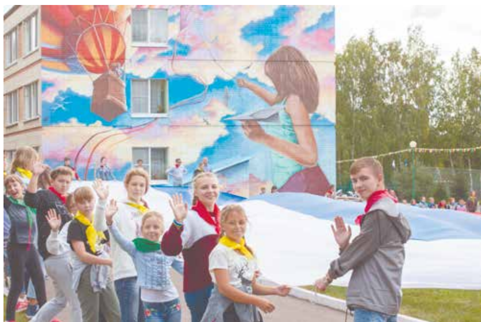
Юные подольчане с удовольствием принимали участие в подвижных играх, эстафетах, музыкальных номерах.