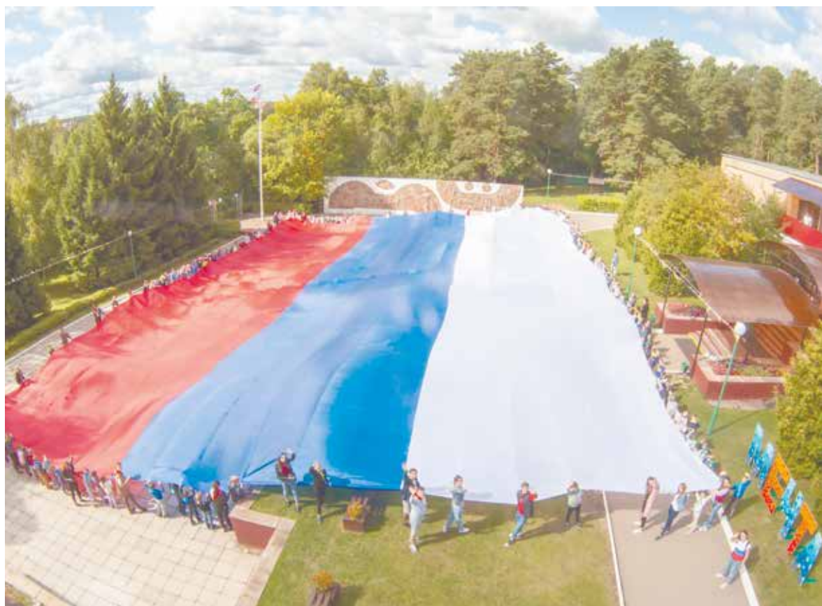
Огромный триколор с площадью полотна свыше 1000 квадратных метров развернули сегодня дети, отдыхающие в оздоровительных лагерях «Ромашка», «Родина» и «Мечта»