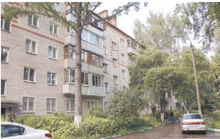
Дом, в котором жил В.В. Похлёбкин в Подольске

Никогда мне не забыть нашу первую встречу на Красной улице, куда он переехал в начале 60-х годов