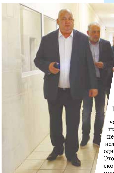
Для более 70000 жителей

Для инфекционного отделения заказаны новое оборудование и мебель, поставка ожидается в ближайшее время. Но главный врач подчеркивает, что для отделений подобного профиля более важно иметь хорошую изоляцию и лабораторию, которые благодаря капитальному ремонту как раз и будут усовершенствованы.