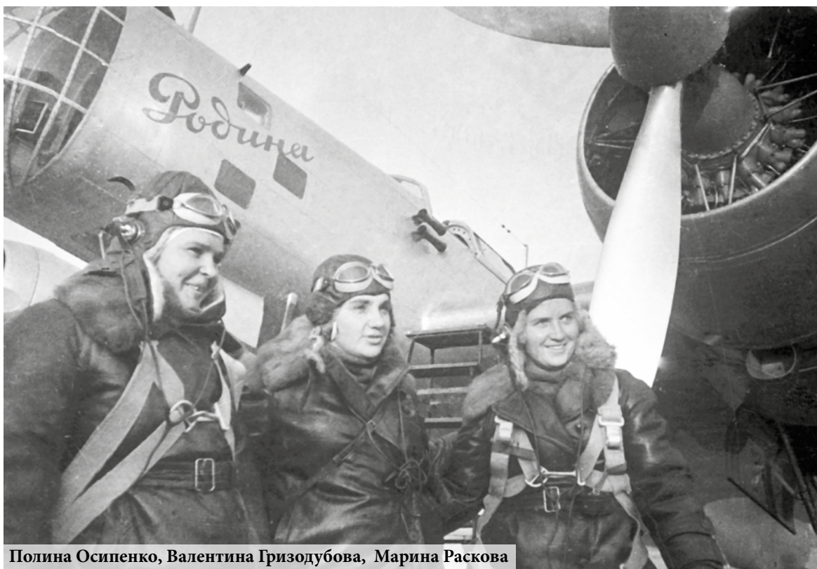
Полина Осипенко, Валентина Гризодубова, Марина Раскова