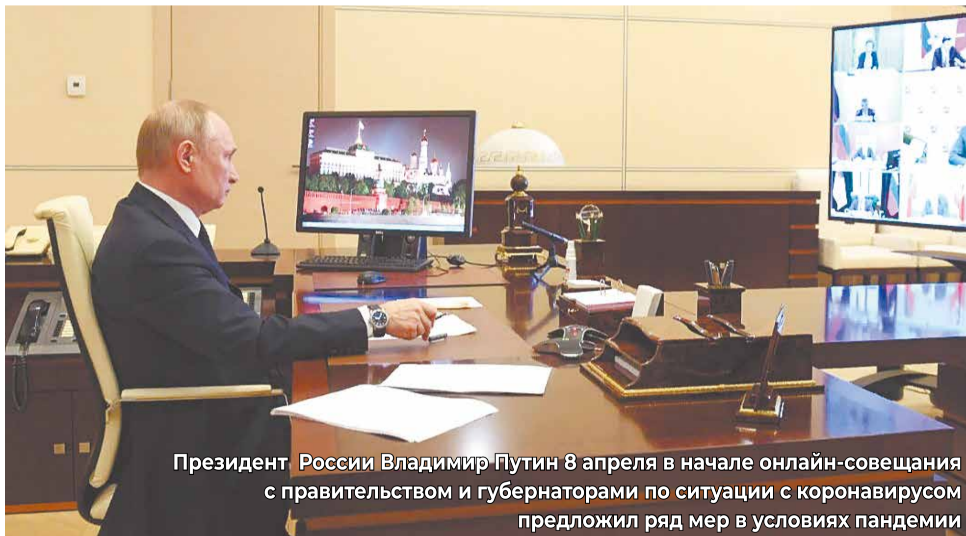
Президент России Владимир Путин 8 апреля в начале онлайн-совещания с правительством и губернаторами по ситуации с коронавирусом предложил ряд мер в условиях пандемии