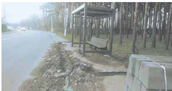
Состояние некоторых остановок на сегодняшний день