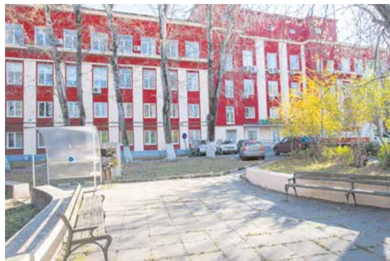
Всякий раз, проезжая мимо ПЭМЗ, вспоминаю свою работу здесь...