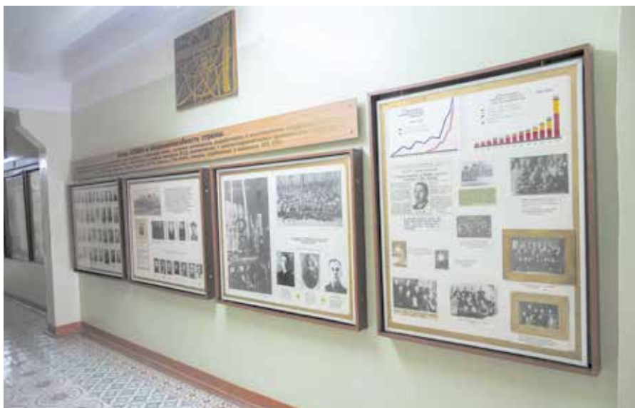
2018 год – год особенный. Заводу исполняется 100 лет.