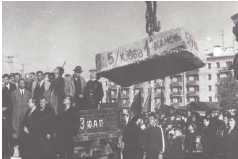
Закладка первого камня в здание будущего ДК «Октябрь»

«Русский народ никогда не сидел без дела, всегда работал, разве что в праздник позволял себе немного расслабиться. Были на Руси профессии уважаемые и редкие, сложные и интересные...». Так красиво начала письмо в редакцию «Местных вестей» подольчанка Таисия Лапкина, которая более 10 лет работала на Подольском электромеханическом заводе. И у нас родилось желание побеседовать с автором письма чтобы вспомнить то время, когда цех № 10 ПЭМЗ для неё был вторым домом