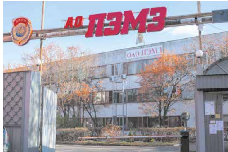
Предприятие долгие годы оставалось закрытым

этом предприятии. Зарождались традиции, появлялись семейные династии. Вырастали дети, внуки и новые люди шли работать на завод. Какое было замечательное время!