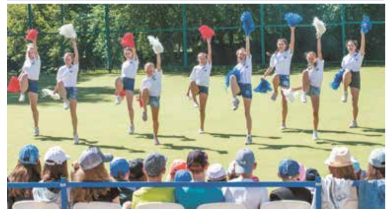
Группа поддержки очаровала зрителей