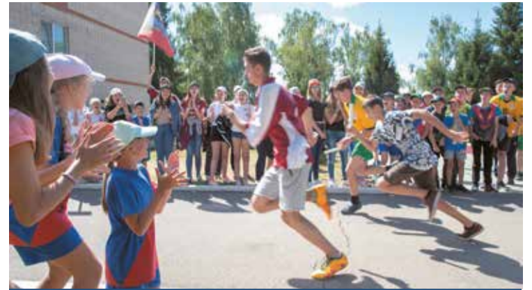
Быстрый старт – залог успеха