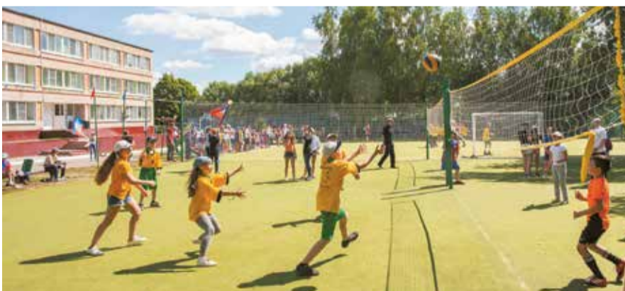
Подачу принимают девчата