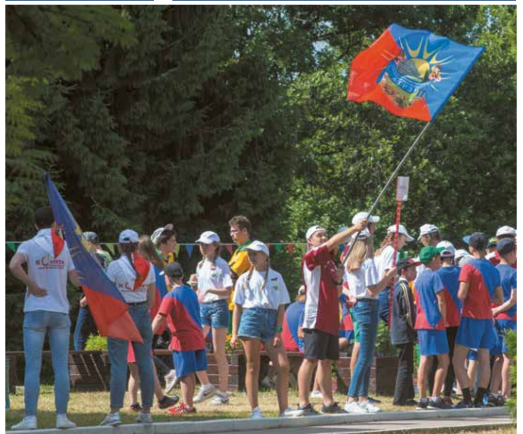
Фанаты «Мечты» – самые громкие

■ Учредитель – Муниципальное автономное учреждение Городского округа Подольск «Медиацентр» ■ Адрес редакции: 142 184, Московская обл., г. Подольск, мкр. «Климовск», ул. Революции, 6. +7 (4967) 69-07-43 ■ Издатель – МАУ «Медиацентр», 142 184, Московская обл., г. Подольск, мкр. «Климовск», ул. Революции, 6. ■ Главный редактор – В.В. Гончаров ■ Компьютерная верстка – Е.А. Филимонова ■ Фотографы – К.С. Шутилин, В.А. Лычагин