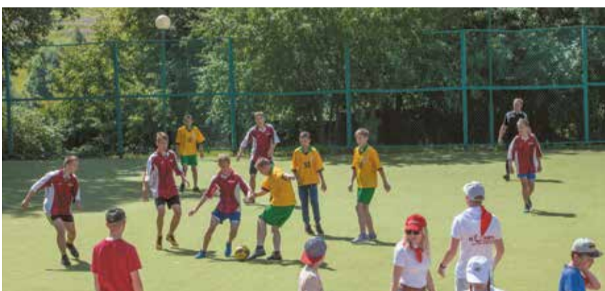
Юные головыны и дзюбы сражаются за победу