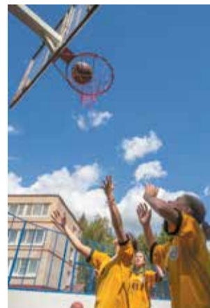
Мяч – в корзине