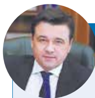
Андрей Воробьёв, губернатор Московской области

Премия «Наше Подмосковье» родилась благодаря неравнодушным людям, которые, несмотря на свои хлопоты, на свою занятость, на безумный и быстрый мир находят время дарить добро, дарить внимание.