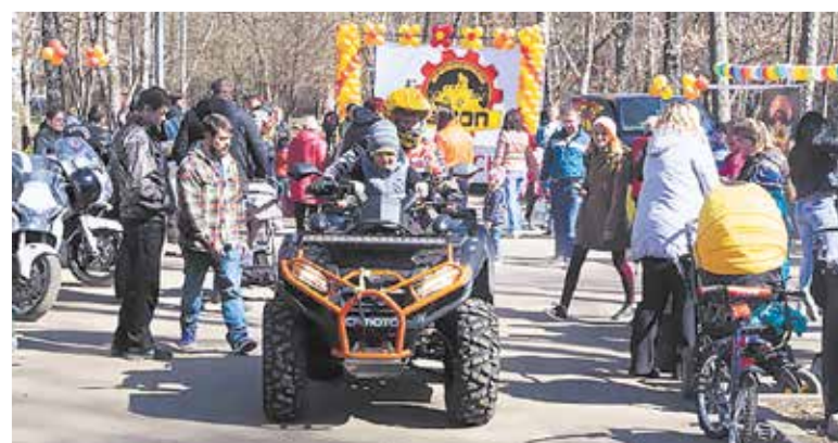
Фестиваль «Квадро Весна» в парке «Берёзки»

мотосезона Городского округа Подольск». Подольское подразделение регионального общественного движения «За содействие развитию спорта» «Вольница».