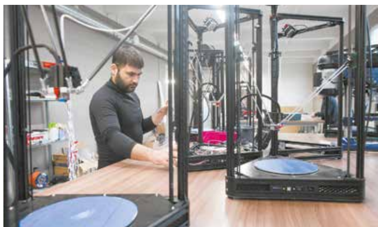
Так реализуется проект «Робокинетика»