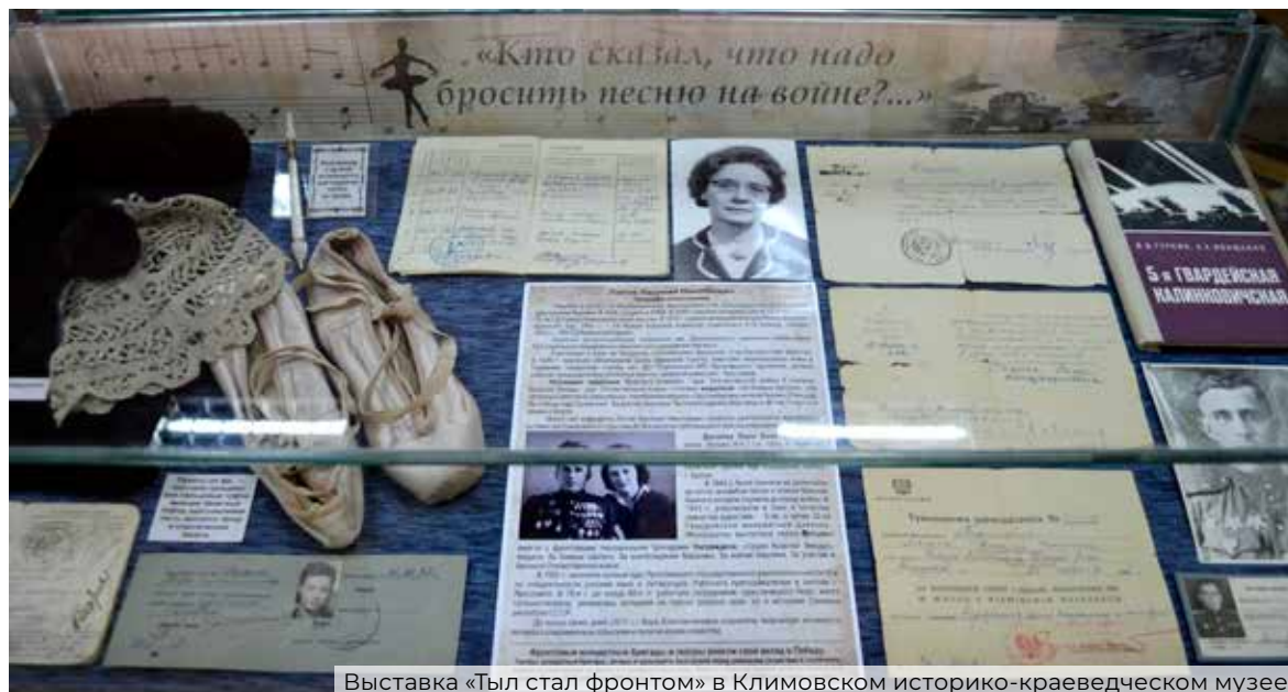
Выставка «Тыл стал фронтом» в Климовском историко-краеведческом музее