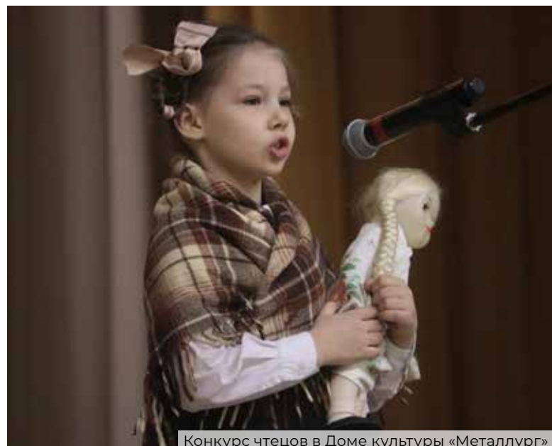
Конкурс чтецов в Доме культуры «Металлург»

Подготовил Василий Михайлов