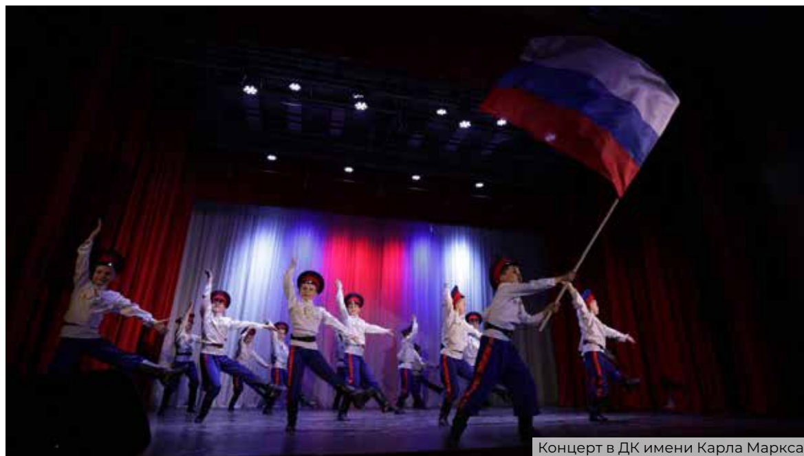
Концерт в ДК имени Карла Маркса