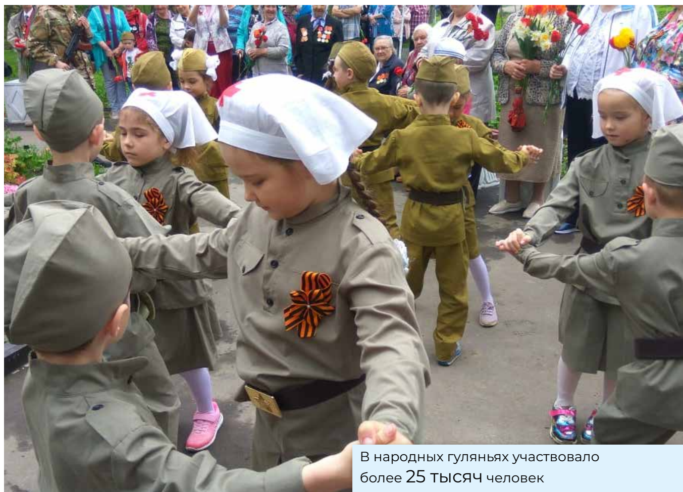
В народных гуляниях участвовало более 25 тысяч человек

42,5 тысячи жителей Большого Подольска встали в колонны «Бессмертного полка»