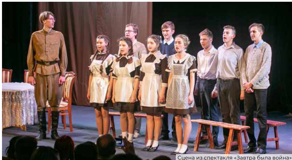
Сцена из спектакля «Завтра была война»

В ДОМЕ КУЛЬТУРЫ имени Карла Маркса зрители посмотрели концерт «Нам надо знать всю правду о войне...». В нем приняли участие творческие коллективы ДК имени Карла Маркса, ДК имени Лепсе, воспитанники центра танцевального спорта «Славянская слобода» и солисты вокального ансамбля «Вдохновение». Объединившись для важного концерта, творческие коллективы смогли невероятно многогранно и в полной мере передать зрителю чувства