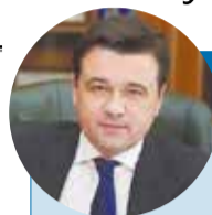
Андрей Воробьёв, губернатор Московской области

которая выплачивалась ранее и зависела от наполняемости класса. Сейчас такой зависимости не будет. Таким образом, когда придёт молодой педагог в школу и будет ещё классным руководи-