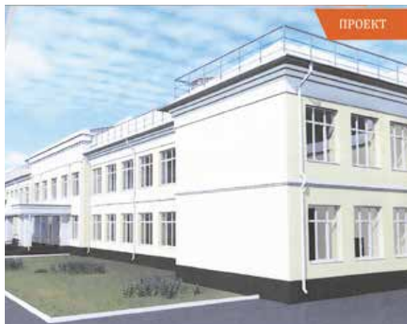
Проект капитального ремонта здания школы №3, мкрн Климовск, ул. Ленина, 23. Завершение – декабрь 2021 года

ЕЖЕГОДНО У НАС УВЕЛИЧИВАЕТСЯ ЧИСЛО ДЕТЕЙ В ШКОЛАХ И ДЕТСКИХ САДАХ. ЗА ПОСЛЕДНИЕ 5 ЛЕТ ДОБАВИЛОСЬ 8 ТЫСЯЧ РЕБЯТИШЕК - 6 ТЫСЯЧ В ШКОЛАХ И 2 ТЫСЯЧИ В ДЕТСАДАХ. ПОЭТОМУ СТРОИТЕЛЬСТВО ШКОЛ И СОЗДАНИЕ МЕСТ В ДЕТСКИХ САДАХ ЯВЛЯЕТСЯ ЖИЗНЕННОЙ ПОТРЕБНОСТЬЮ.