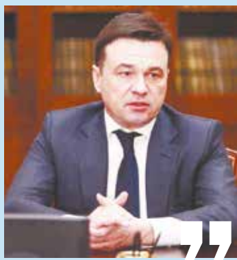
Губернатор Московской области Андрей ВОРОБЬЕВ:

– Важно помнить, что проблема – это лишь препятствие на пути к цели. А цель наша одна – добиться постоянного повышения качества жизни. Цифры, отчеты, квадратные метры – необходимы, безусловно, в государственном управлении, но большинству – они неинтересны. Человеку интересны перемены в месте, где он живет. Интересен чистый подъезд, широкий тротуар без выбоин, флагманская школа и работа рядом с домом.