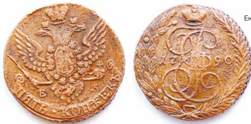
Монета 5 копеек Екатерины II 1790 года (аверс и реверс)

На двух монетах, экспонируемых в музее, на аверсе рельефно изображены двуглавый орел, герб с Георгием Победоносцем, поражающим змея, императорская корона российских монархов, надпись «пять коп(буква «ять»)екъ» и буквы «ЕМ», что означает, что монеты отчеканены на Екатеринбургском монетном дворе. На реверсе рельефно изображены вензель Екатерины II, императорская корона, две соединенные ветви лавра и пальмы, на одной из монет – «1763», на второй – «1790», что указывает на годы чеканки монет.