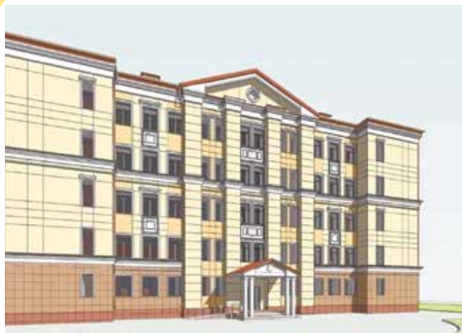
Проект капитального ремонта здания школы №5, мкрн Климовск, ул. Симферопольская, 5а. Завершение – декабрь 2021 года