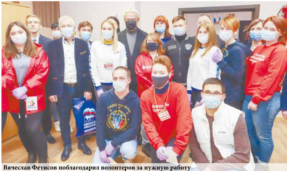
Вячеслав Фетисов поблагодарил волонтеров за нужную работу