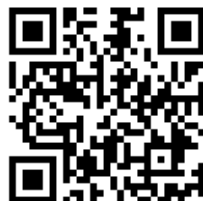
График приема: www.er-podolsc.ru/news/1329

Вопросы можно задать по телефону: +7 (4967) 69-06-90; +7 (4967) 63-48-20.