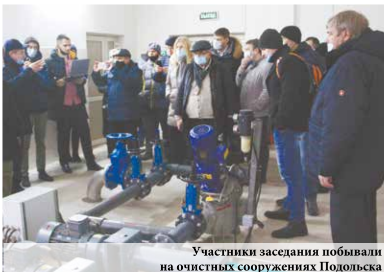
Участники заседания побывали на очистных сооружениях Подольска

очистных сооружениях округа. Им рассказали о масштабах работ, проведенных на этих сооружениях, и изменениях, которые произошли за последние пять с половиной лет с момента объединения в единый городской округ территорий бывших городов Подольска, Климовска и Подольского района.