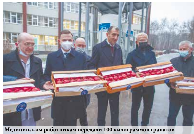
Медицинским работникам передали 100 килограммов гранатов

– Огромная благодарность нашим врачам и медсестрам, работникам скорой помощи. Всем тем, кто сегодня работает в «красной зоне» в режиме 24 часа в сутки. Мы видим, как подвиги рождаются каждый день, – сказал Вячеслав Фетисов. – Конечно, мы не могли в начале зимы не приехать, не поблагодарить. Привезли гранаты,