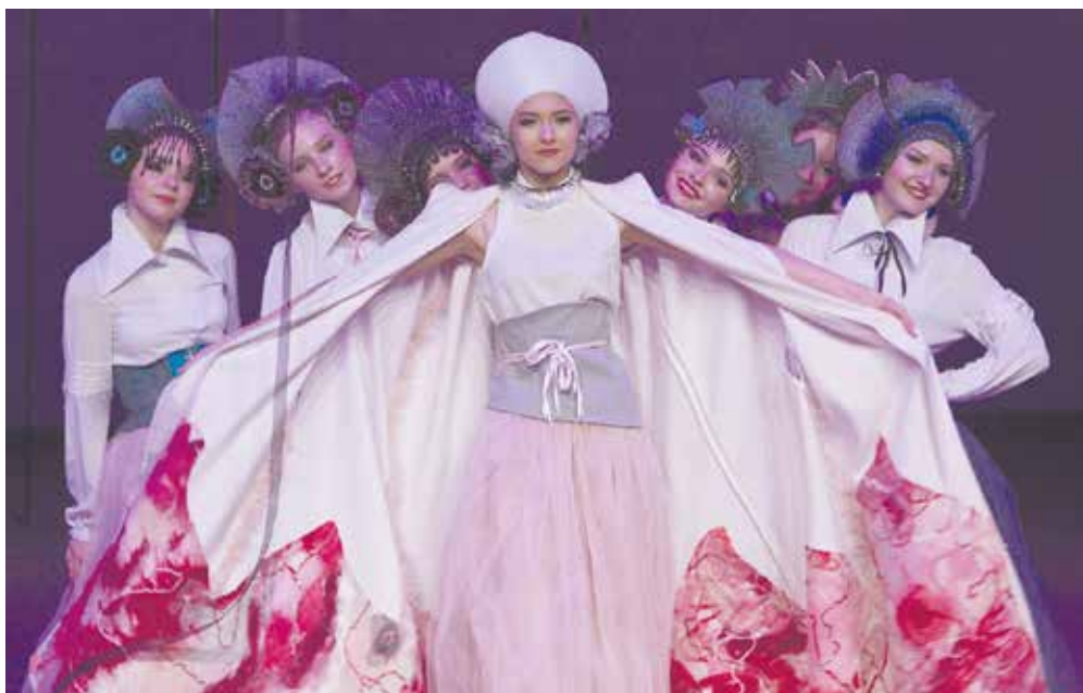
Фото: Михаил Федин // Театр моды «Эксклюзив»