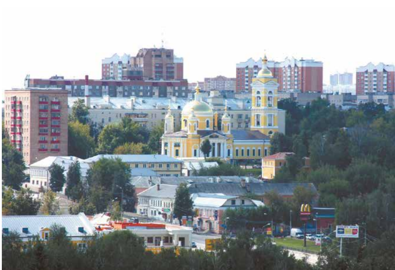
Вид на Свято-Троицкий собор Подольска, построенный в 1819–1832 гг. в честь победы в Отечественной войне 1812 года

■ Учредитель – Муниципальное автономное учреждение Городского округа Подольск «Медиацентр» ■ Адрес редакции: 142 184, Московская обл., г. Подольск, мкр. «Климовск», ул. Революции, 6. +7 (4967) 69-07-43 ■ Издатель – МАУ «Медиацентр» 142 184, Московская обл., г. Подольск, мкр. «Климовск», ул. Революции, 6. ■ Главный редактор – В.В. Гончаров ■ Компьютерная верстка – Е.А. Прохорова ■ Фотографы – К.С. Шутилин, В.А. Лычагин