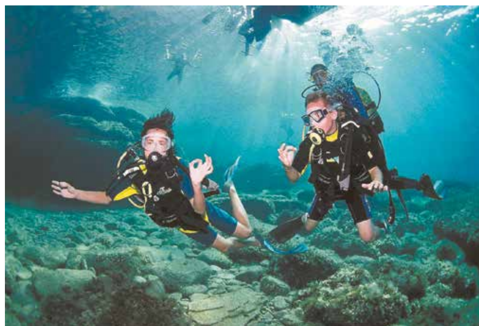
Подводный мир глазами дайверов

Вода в озере довольно чистая, что и подтверждают многочисленные раки,ывавшие карьер местом обитания. Наблюдать за раками очень интересно, но даже если их удалось