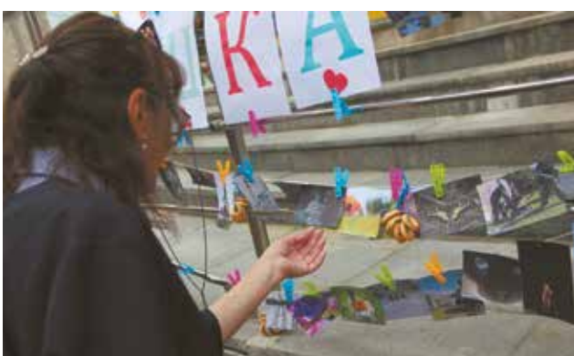
На «фотосушке» можно было обменять фотки

Дмитрий Дойников, фото МЦ «Максимум» и свободных источников