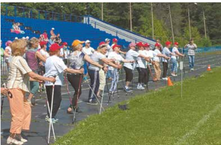
Освоить технику скандинавской ходьбы достаточно легко

Своим появлением скандинавская ходьба (Nordic Walking) обязана профессиональным лыжникам, которые в летние периоды тренировок не имели возможности заниматься на снегу и прибегали к имитированию лыжных ходов. После появления роликовых лыж летние тренировки спортсменов стали более продуктивны, а популярность имитационной ходьбы начала развиваться в обществе. Скандинавская ходьба особенно рекомендуется при наличии следующих заболеваний: остеохондроз, синдром ВСД, бессонница, запоры, проблемы с сердечно-сосудистой системой.