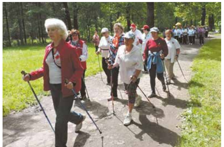
Популярность скандинавской ходьбы в Большом Подольске растет