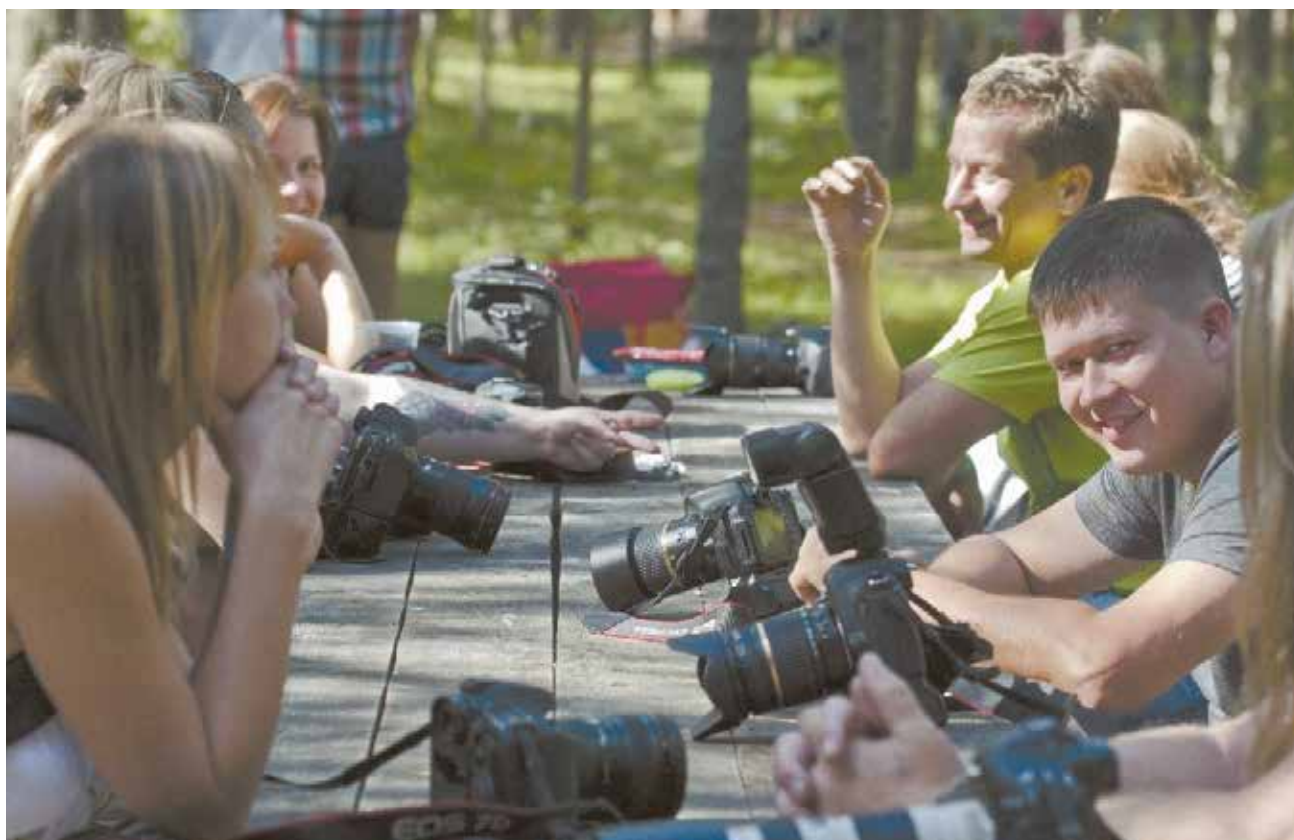
Попробовать стать фотографом может каждый