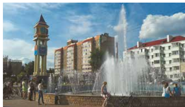
Городские часы и фонтан в Сквере поколений