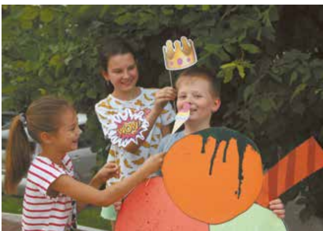
Будущие фотохудожники в Парке Победы