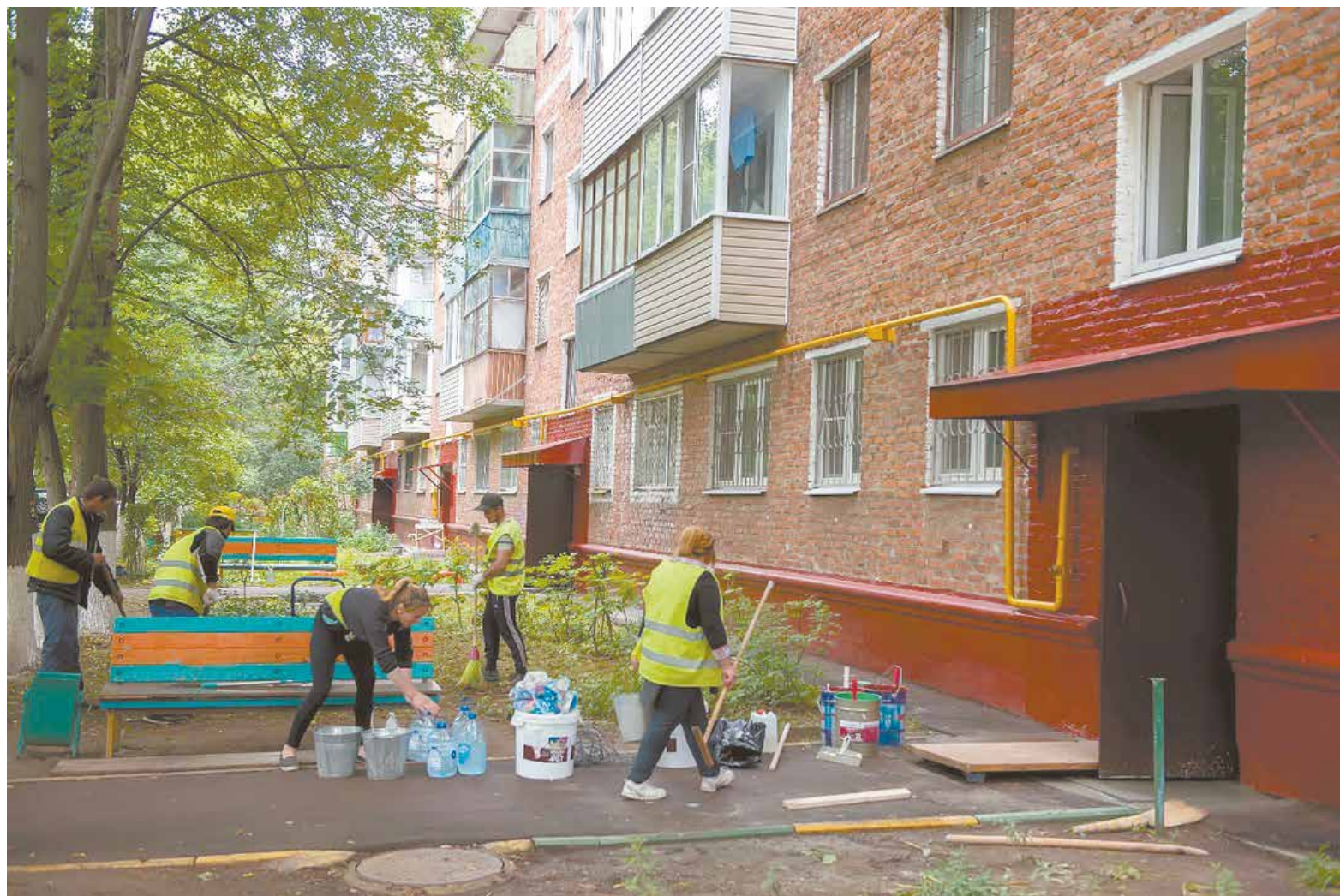
Улица Машиностроителей, д. 28а

В Городском округе Подольск активно идет реализация программы губернатора Московской области Андрея Воробьева «Мой подъезд» по ремонту подъездов многоквартирных жилых домов