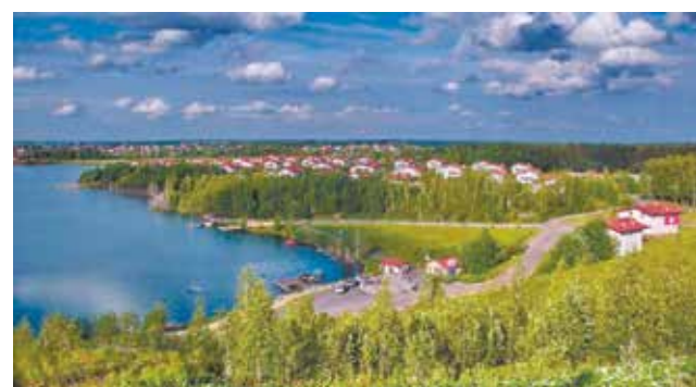
Дайвинг в Подмоскowie становится популярным