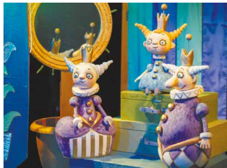
На снимках: сцены из спектаклей театра