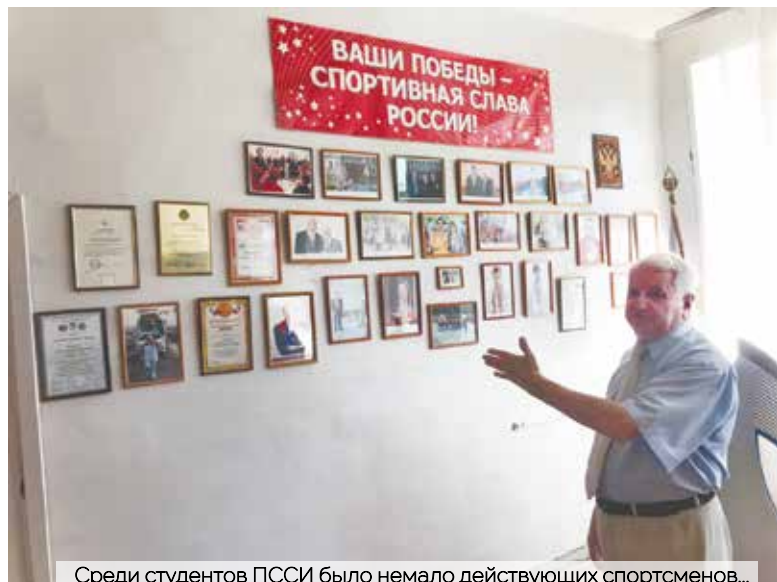
Среди студентов ПССИ было немало действующих спортсменов...

ПССИ является еще и базовым для Паралимпийского комитета. Среди учащихся и выпускников учебного заведения члены сбор-