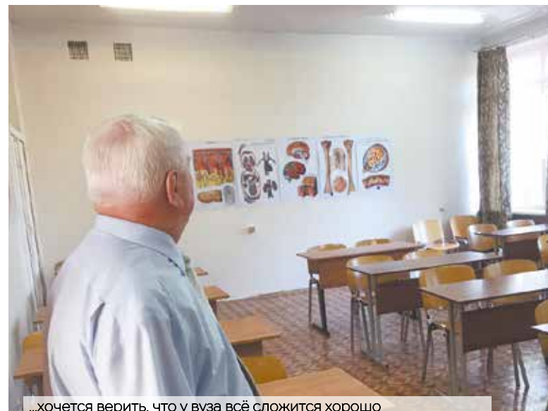
...хочется верить, что у вуза всё сложится хорошо

Городской округ Подольск является самым большим по численности населения, да и по своему экономическому потенциалу