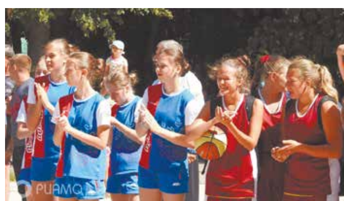
«Мы играли в волейбол»

В честь праздника состоялись соревнования по пулевой стрельбе