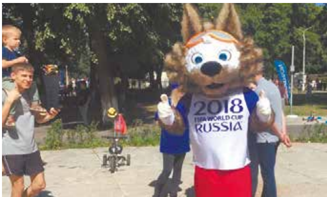
Чемпионат мира закончился – Забивака остался