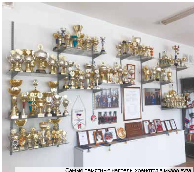
Самые памятные награды хранятся в музее вуза

Приостановка действия государственной аккредитации распространяется на все структурные подразделения и филиалы учебного заведения. Прием в образовательную организацию прекращается в случае неисполнения предписаний Рособрнадзора.