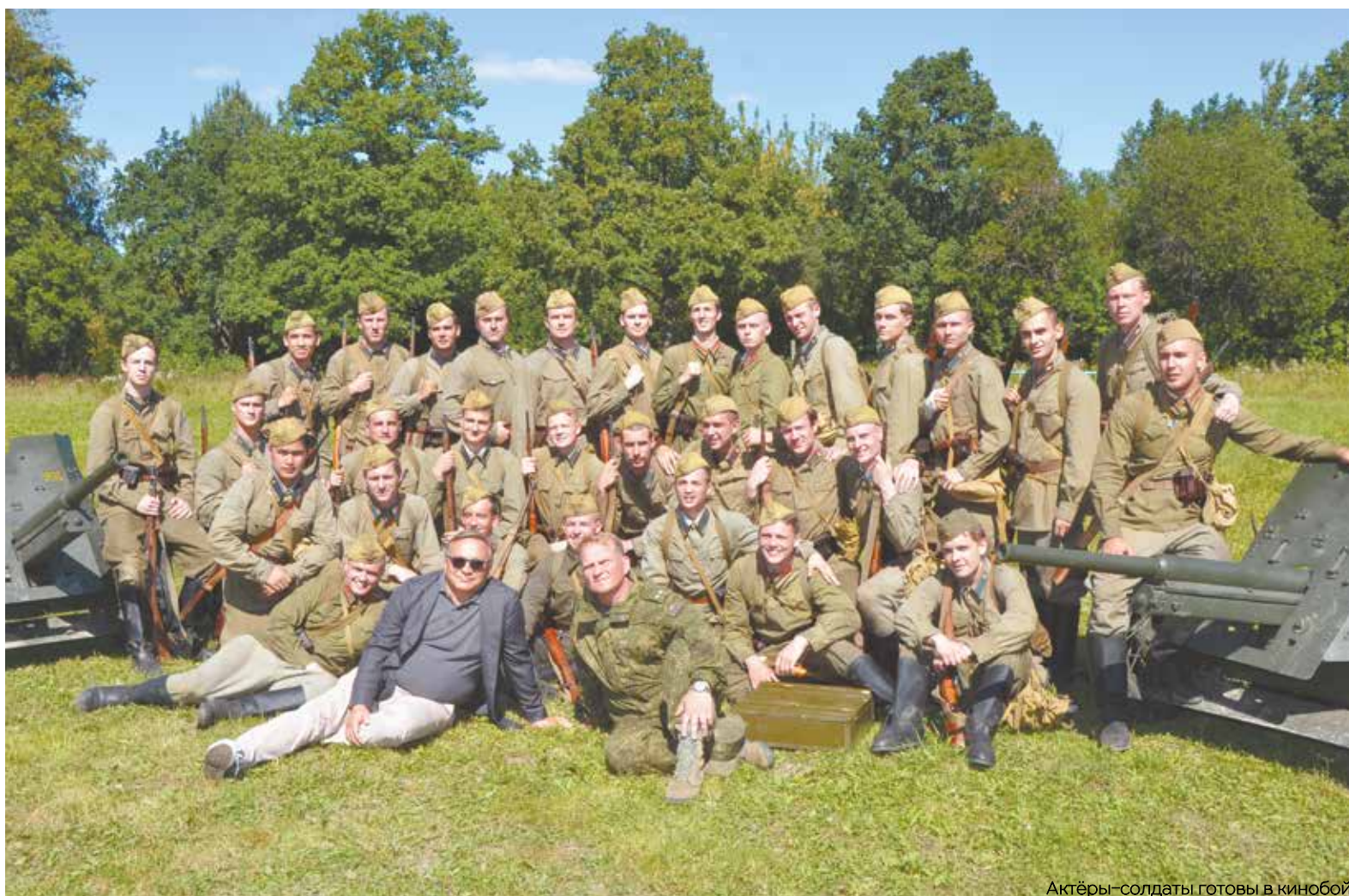
Актёры-солдаты готовы в кинобой

Это большое событие в общественной и культурной жизни Большого Подольска произойдет в четверг, 16 августа. Для того, чтобы оно состоялось, киностудией «Военфильм» проведена основательная подготовительная работа. Сегодня «Местные вести» постараются сжато рассказать об этом