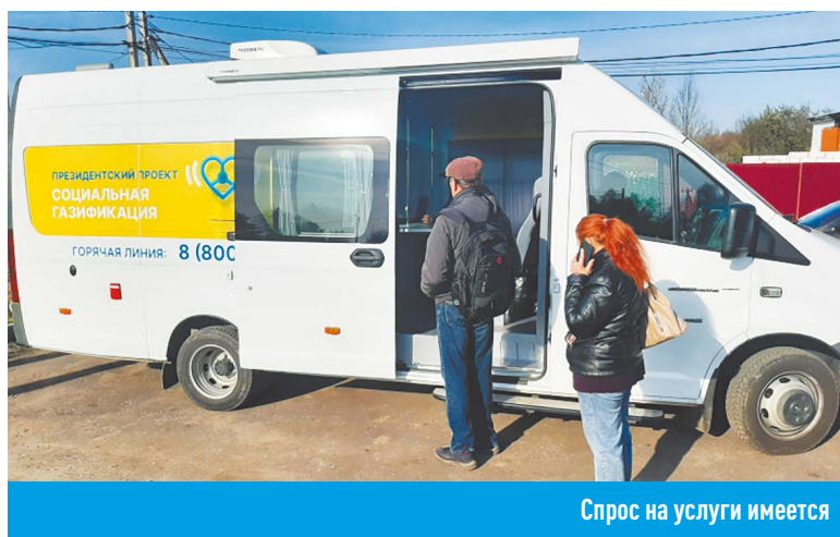
Спрос на услуги имеется