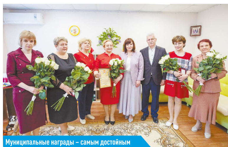
Муниципальные награды – самым достойным

Еще 12 уже имеющихся площадок модернизируют за счёт средств муниципалитета.