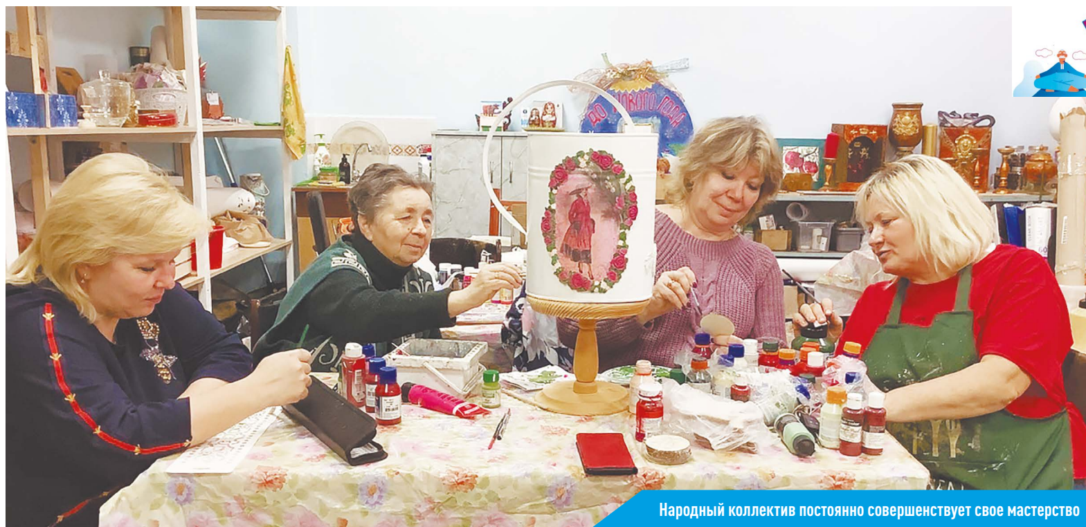
Народный коллектив постоянно совершенствует свое мастерство