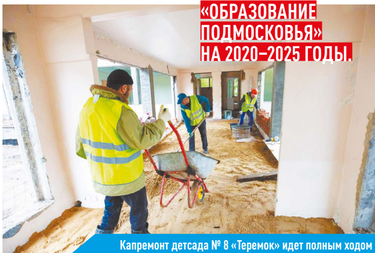
Капремонт детского сада № 8 «Теремок» идет полным ходом

КАПИТАЛЬНЫЙ РЕМОНТ ДЕТСАДА № 8 «ТЕРЕМОК» ВЫПОЛНЯЕТСЯ ПО ГОСПРОГРАММЕ МОСКОВСКОЙ ОБЛАСТИ «ОБРАЗОВАНИЕ ПОДМОСКОВЬЯ» НА 2020–2025 ГОДЫ.