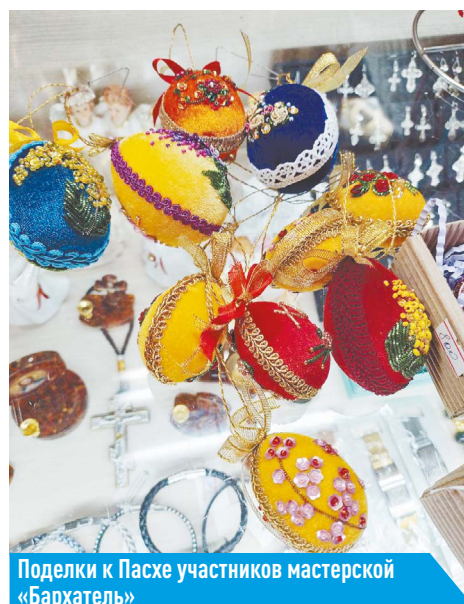
Подделки к Пасхе участников мастерской «Бархатель»

Внимание! Квитанцию можно получить в свечной лавке 142121, Московская область, г. Подольск, ул. 43-й Армии, д. 24, тел.: +7 (985) 380-39-37