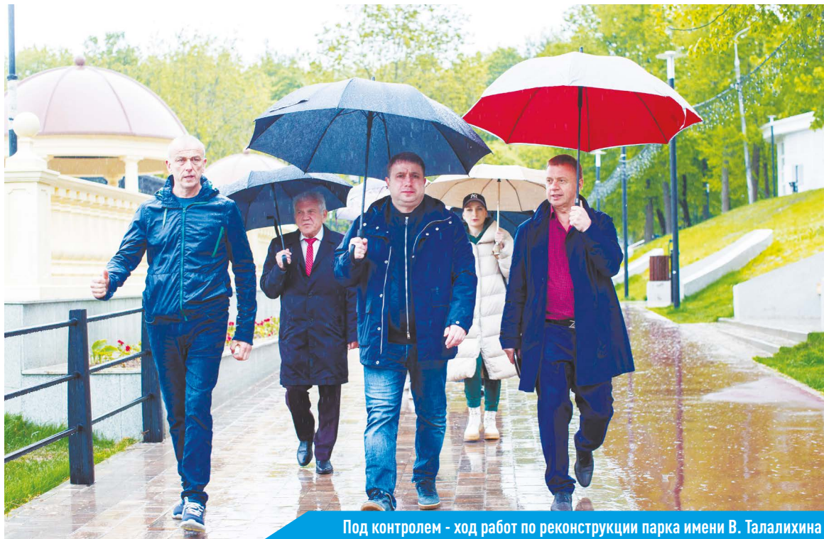
Под контролем - ход работ по реконструкции парка имени В. Талалихина

Будущая новая танцевальная площадка с открытой сценой станет в парке местом