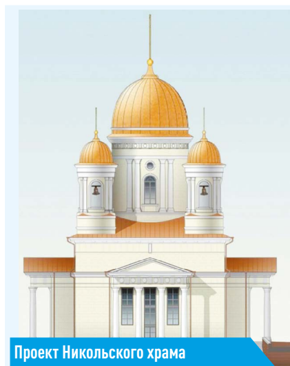
Проект Никольского храма