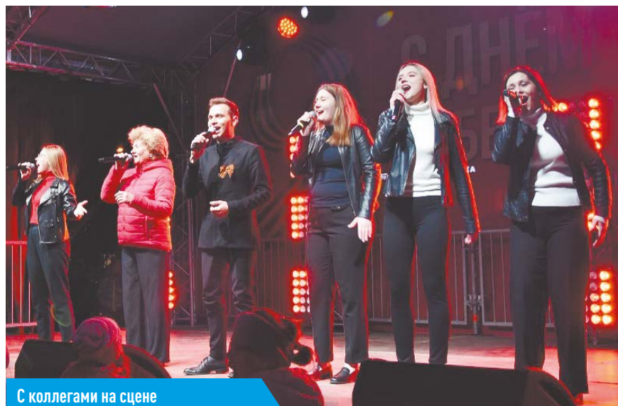
С коллегами на сцене

Андрей Князев