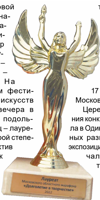
Лауреат Московского областного марафона «Долголетие в творчестве» 2022

Церемония награждения конкурсантов проходила в Одинцово. Внушительных размеров сказочная экспозиция подольчан включала в себя работы, выполненные в технике классического декупажа, лепка, кукла Тильда и многих других.