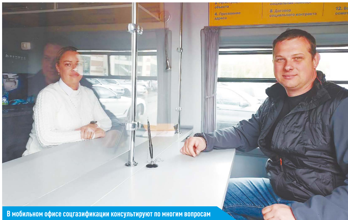
В мобильном офисе соцгазификации консультируют по многим вопросам

Сотрудники офиса предоставляют следующие услуги: оформление заявки и заключение комплексного договора, заключение договора на техническое обслуживание газового оборудования, регистрация дома, присвоение адреса, применение понижающего коэффициента 0,7 на электроэнергию, перерасчет за оказание услуги вывоза твердых коммунальных отходов, экстренная социальная помощь, договор социального контракта, оказание услуг на дому, льготы Федеральной налоговой службы,