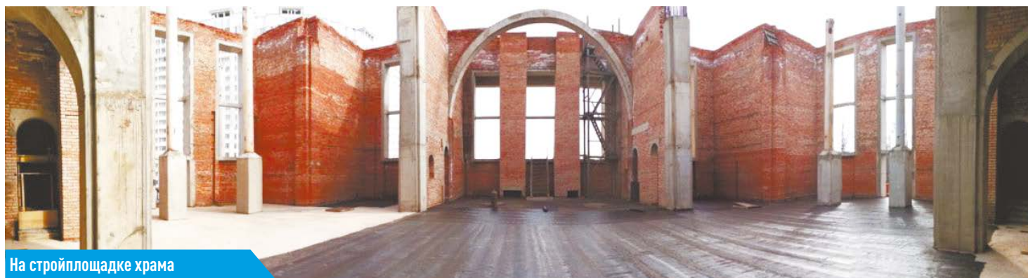
На стройплощадке храма