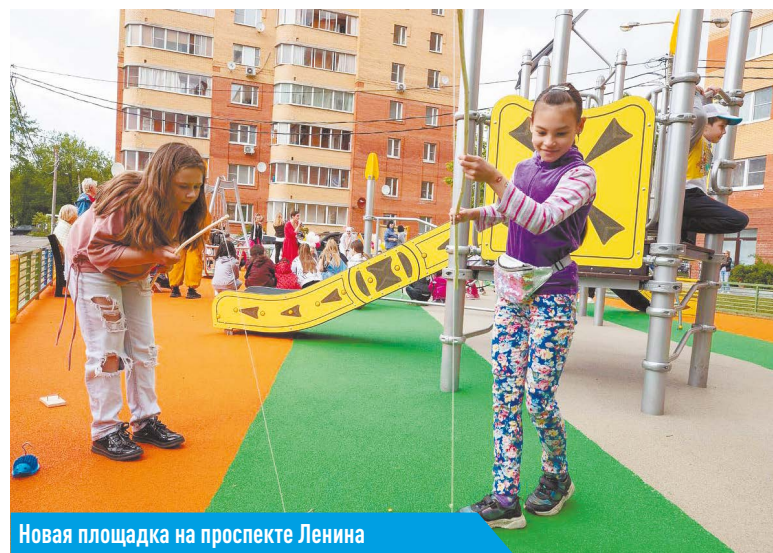
Новая площадка на проспекте Ленина

Дети – наша жизнь. Каждый ребёнок должен воспитываться в ласке, заботе, тепле и доброте. Именно такую опеку над малышами, оставшимися