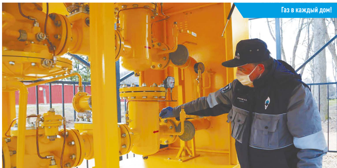
Газ в каждый дом!