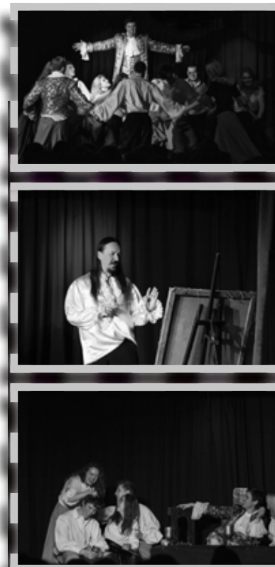
Фото дома культуры имени Лепсе