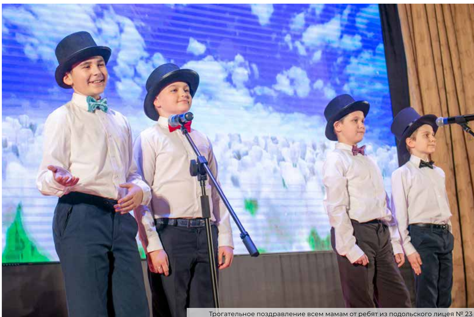
Трогательное поздравление всем мамам от ребят из подольского лицея № 23