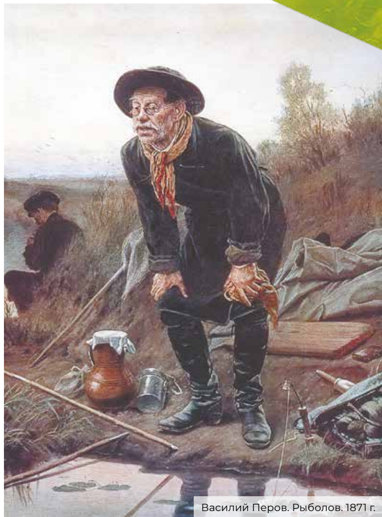
Василий Перов. Рыболов. 1871 г.

– Это не то удовольствие. Я считаю, рыбалка должна быть дикой. Да к тому же на платной рыбалке, что и сколько ты поймаешь, зачастую зависит от хозяйки водоема.