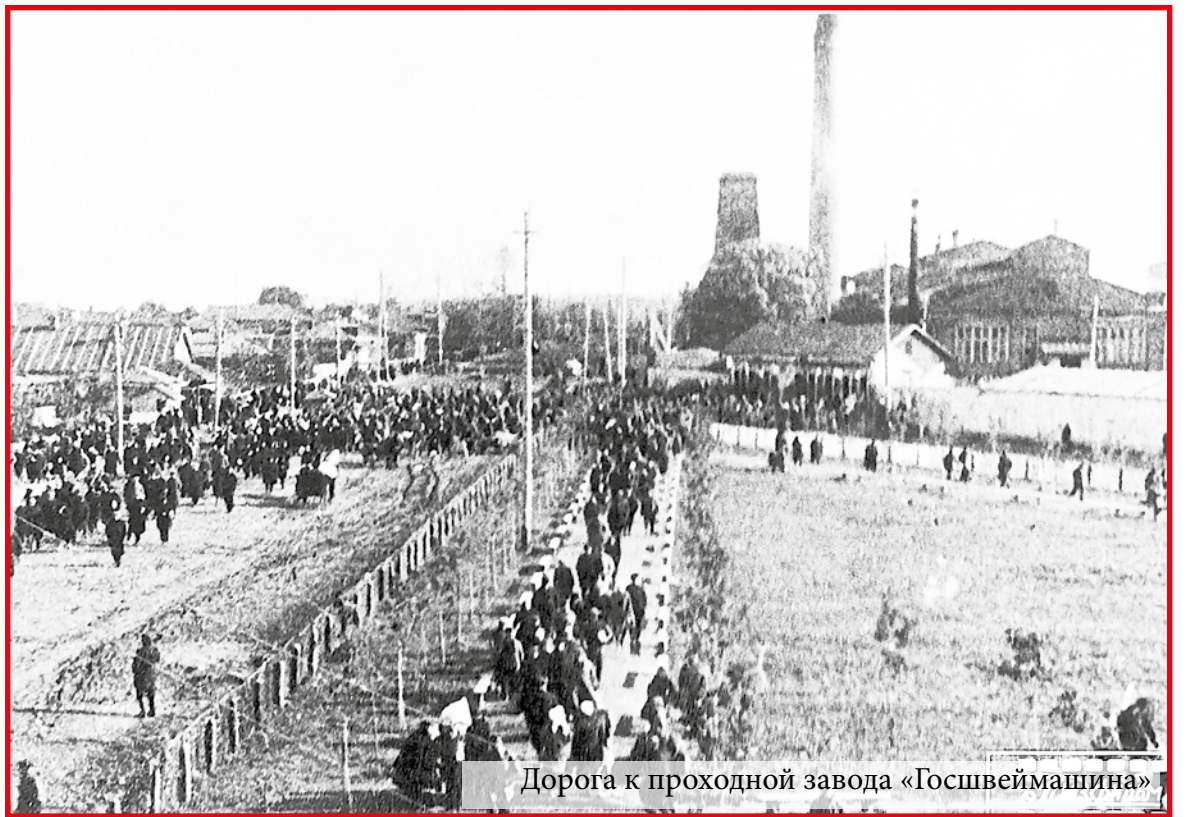
Дорога к проходной завода «Госшвеймашина»

1 июня 1920 года Совет Труда и Оборона принял постановление о включении подольских патронного, паровозоремонтного и оптического заводов, на которых было занято 9222 рабочих, в число 40 предприятий республики,