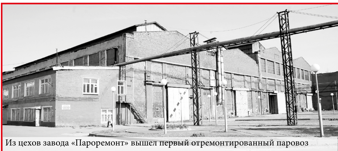
Из цехов завода «Пароремонт» вышел первый отремонтированный паровоз