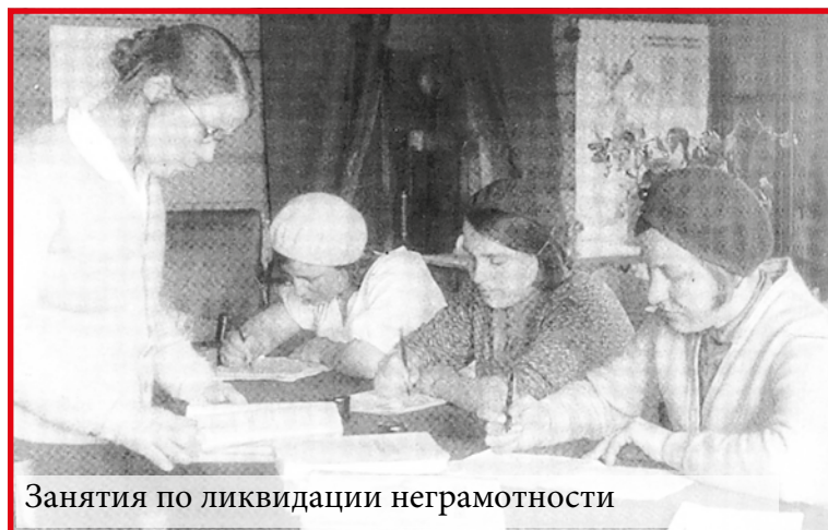
Занятия по ликвидации неграмотности

Число работающих на предприятиях города на 1 октября 1928 года достигло 10 тыс человек.