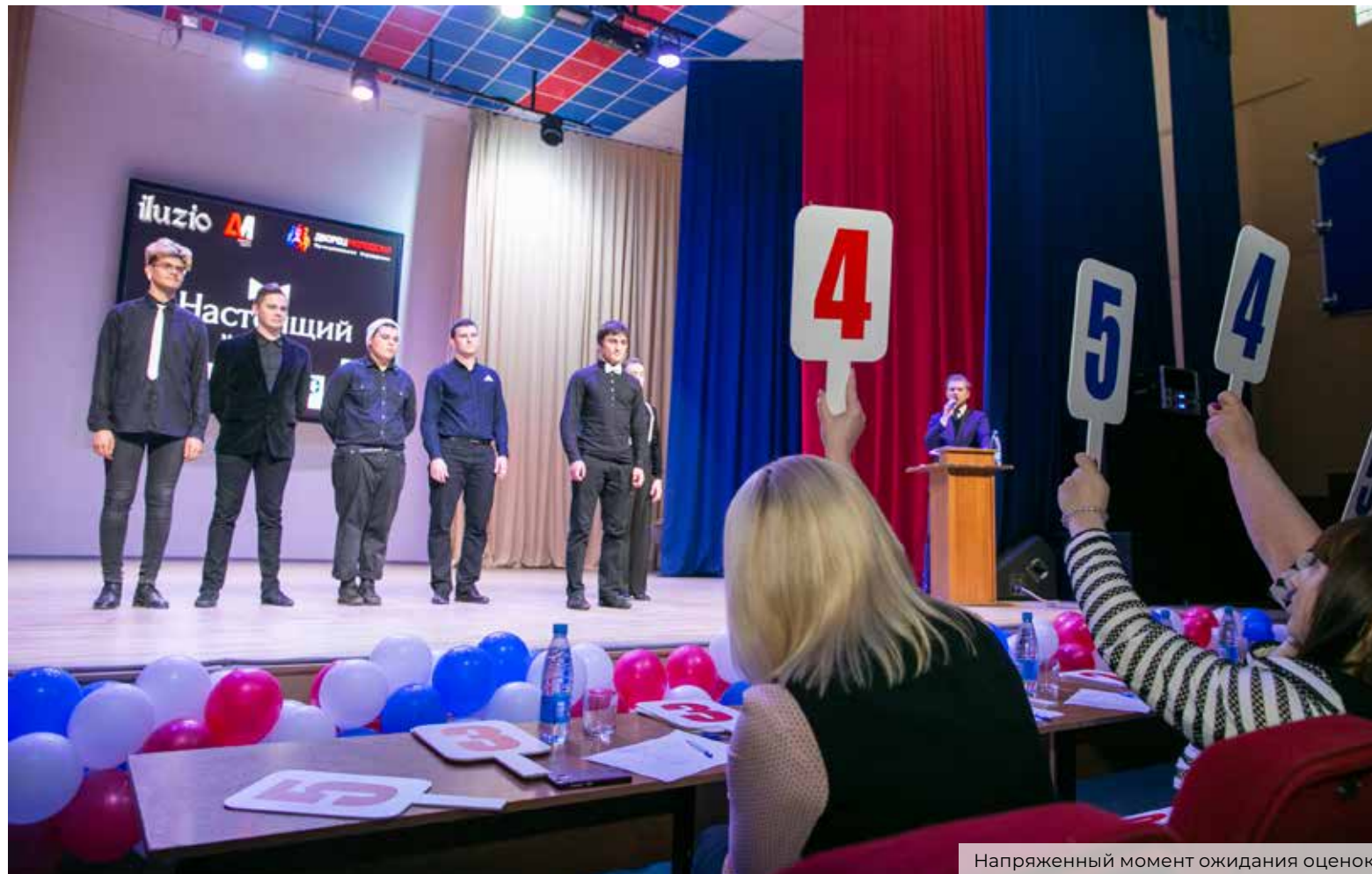
Напряженный момент ожидания оценок

В минувшую пятницу Дворец молодежи в городском округе Подольск встречал участников и гостей конкурса «Настоящий мужчина» – 2019