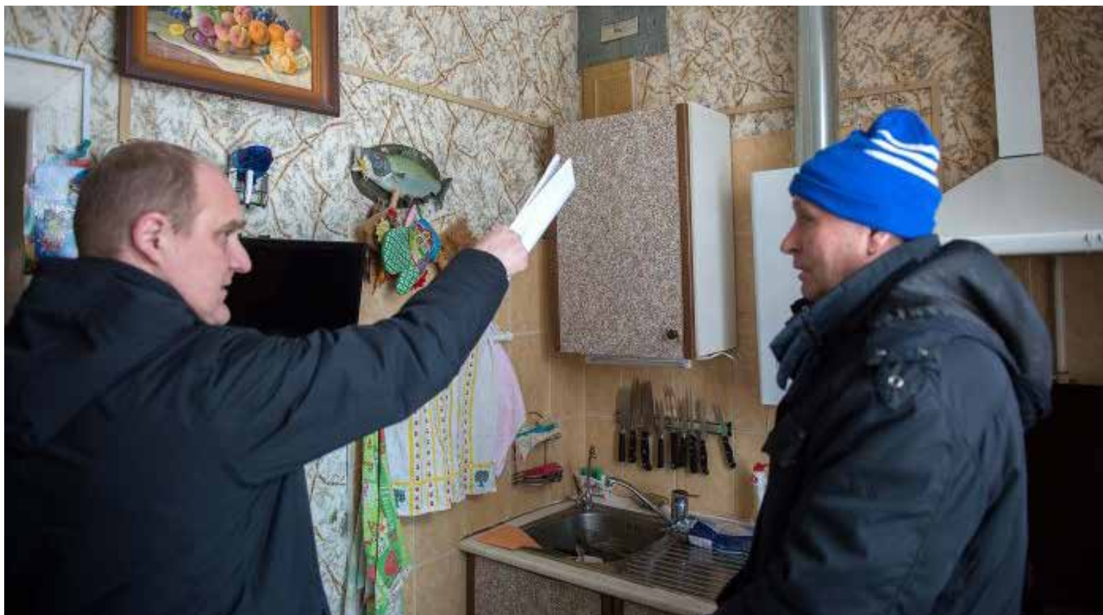
Фото Андрея Сигиды

Пресс-служба администрации Городского округа Подольск