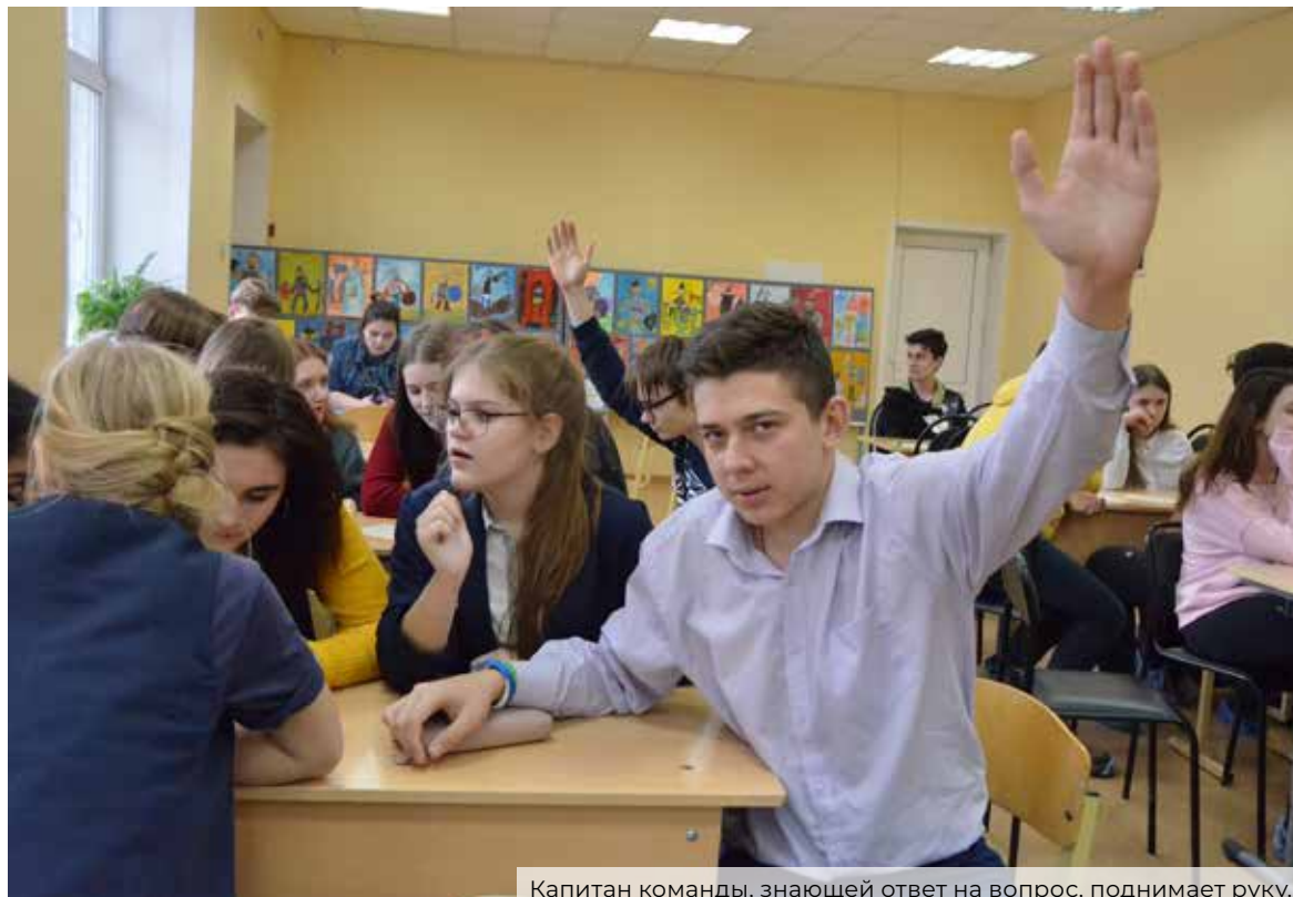
Капитан команды, знающей ответ на вопрос, поднимает руку.