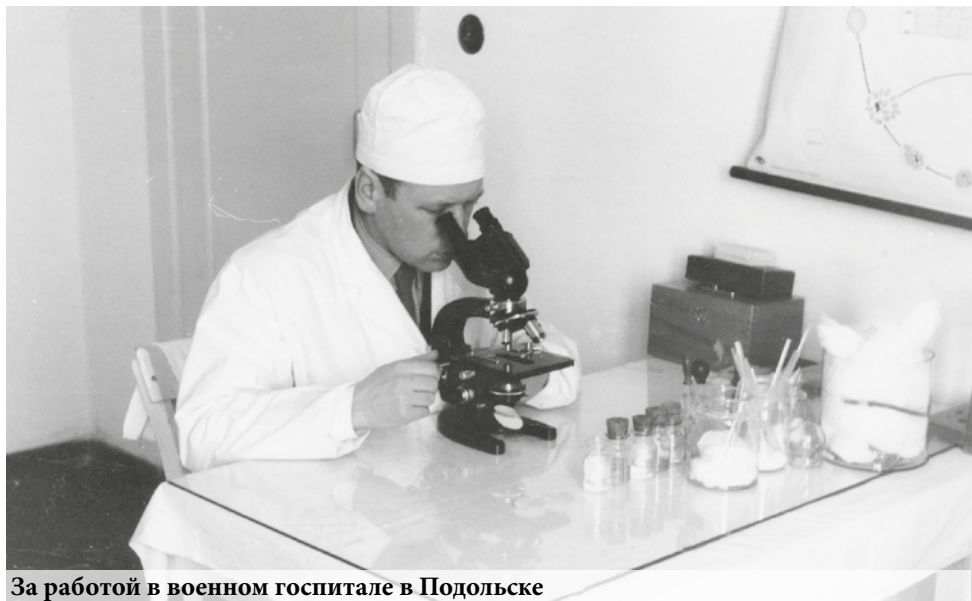
За работой в военном госпитале в Подольске

В те послевоенные годы вся военная техника в армии была из США, полученная по ленд-лизу. Моя санитарная машина – грузовик фирмы «Студебеккер»