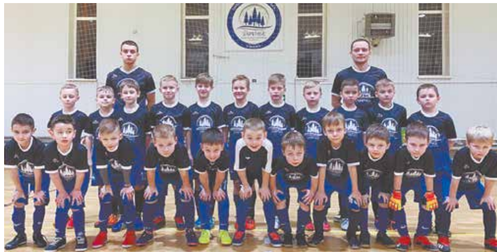
В трех возрастных группах игрового состава ФСК «Заречье» – Подольск 24 юных спортсмена: 2011, 2012 и 2013 годов рождения