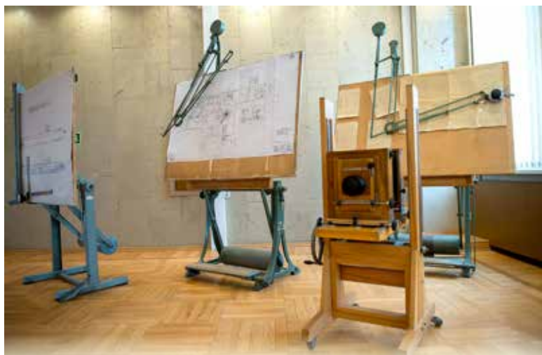
Ещё лет тридцать назад в конструкторских бюро стояли рядами многочисленные кульманы, сейчас в КБ главным рабочим инструментом является компьютер и различные печатающие устройства. Но еще где-нибудь можно встретить собранные в одно местечко старые, добрые кульманы – как память давно ушедших и забытых чертежных дел.