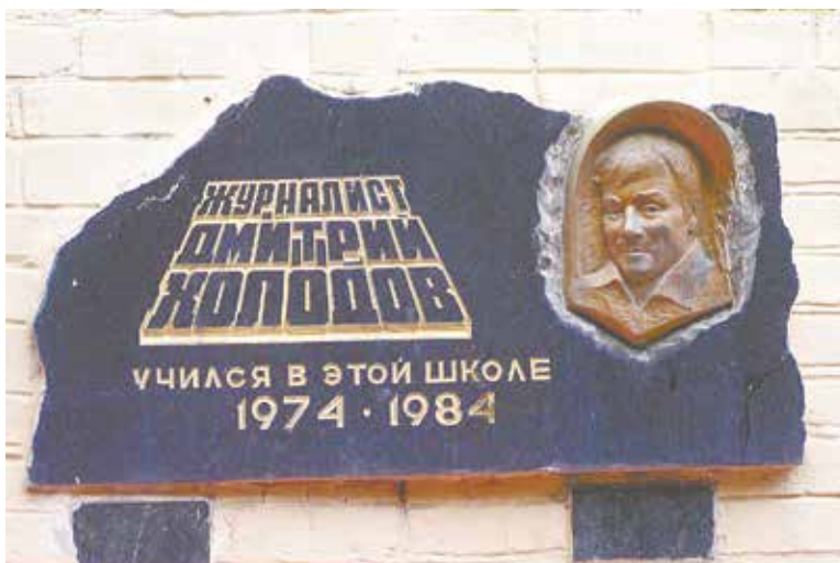
Мемориальная доска на климовской школе № 5, носящей имя Дмитрия Холодова