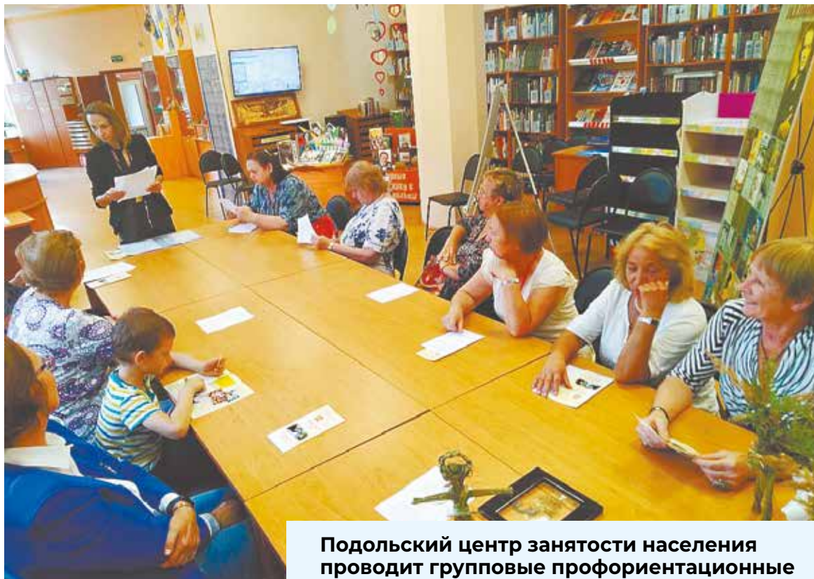
Подольский центр занятости населения проводит групповые профориентационные занятия в октябре

В октябре Подольский центр занятости населения проводит групповые профориентационные занятия, на которые приглашает всех желающих. Учреждение не только оказывает социальную поддержку безработным гражданам, помогает в поиске работы, но и реализует программы по профессиональной ориентации. Государственная услуга предоставляется гражданам Российской Федерации, иностранным гражданам, лицам без гражданства