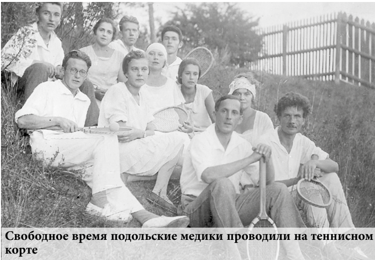
Свободное время подольские медики проводили на теннисном корте