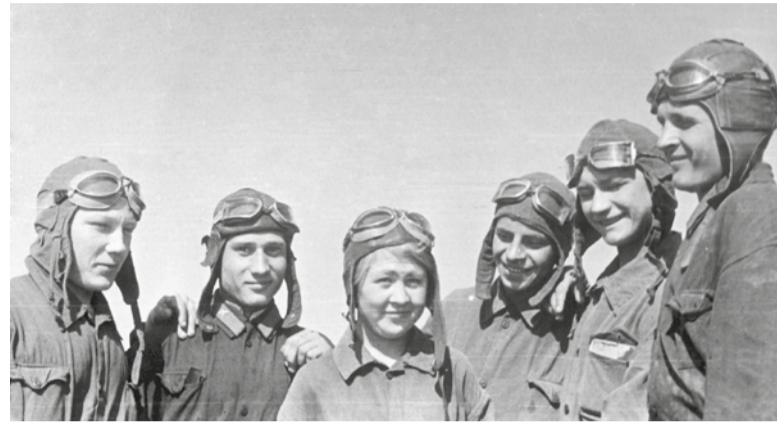
Курсанты Подольского аэроклуба, 1938 г.

Ил-2, имел 12 правительственных наград, в том числе орден Александра Невского. Участвовал в воздушных парадах в Тушино. В 1953 году был ведущим в слове «СССР» из 45 самолетов Як-18. Был не менее десяти раз «похоронен», когда падал, горел... В 1947 году работал заместителем начальника Якутского управления ГВФ по лётной службе,