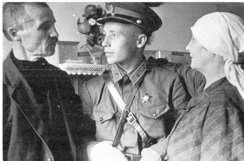
Встреча Виктора Талалихина с родителями

16 октября в Краеведческом музее Городского округа Подольск открывается выставка «177-й истребительный авиационный полк 1941 г. Герой Советского Союза Виктор Талалихин», посвящённая подвигу прославленного лётчика. Посетители познакомятся с фондами Краеведческого музея, а также увидят копии документов Центрального архива Министерства обороны РФ. Выставка продлится до 28 октября.