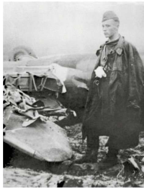
У сбитого «Хейнкеля»

Ошеломленные внезапной атакой, немецкие пилоты растерялись и повернули назад. Со-