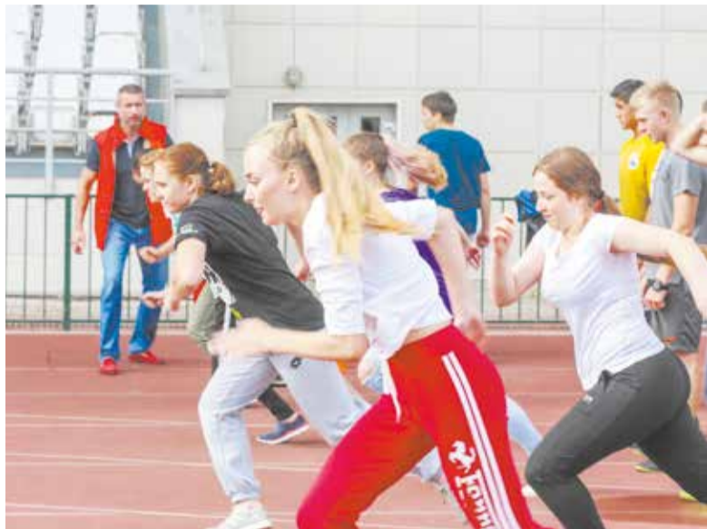
Фото Кирилла Шутилина

Пресс-служба администрации Городского округа Подольск