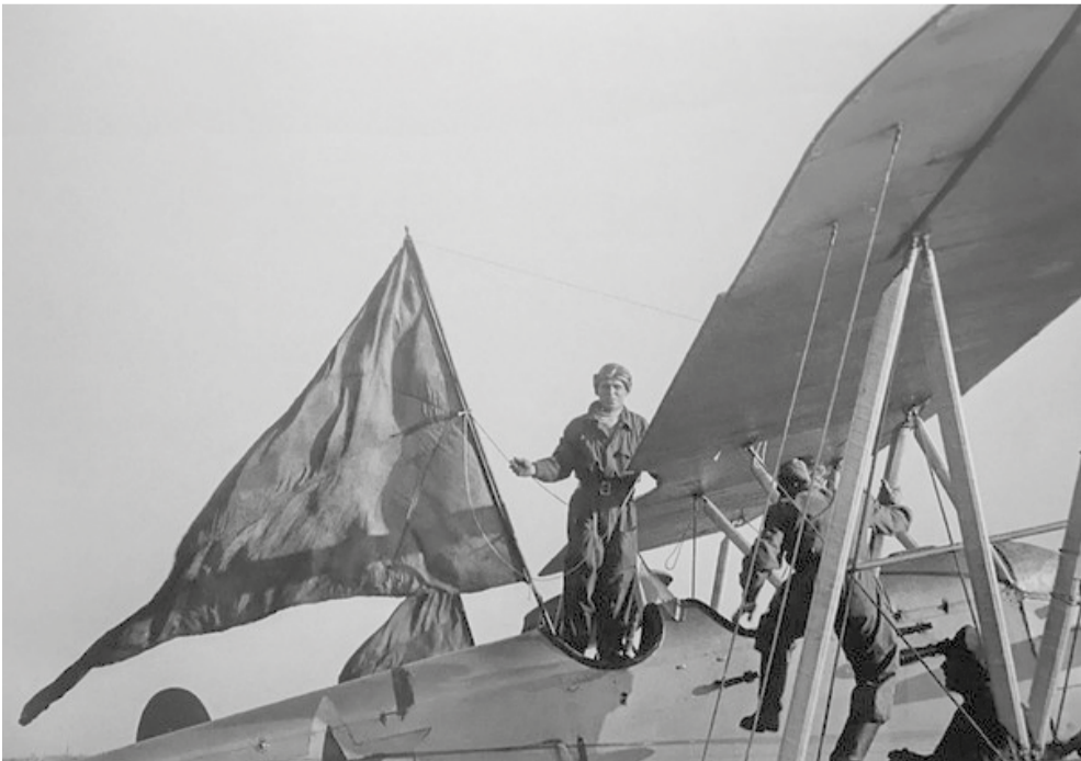
Для торжественного полёта на параде к самолёту По-2 крепится красный флаг