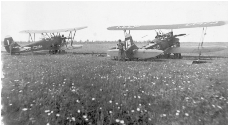
Филиал аэроклуба в селе Молоди. На первом плане два самолета на лётном поле - 1939 г.