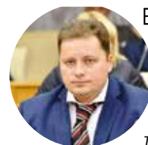
Евгений Хромушин, министр жилищно-коммунального хозяйства Московской области

Губернаторская программа по установке новых детских площадок реализуется в Московской области уже третий год подряд. В период с 2013 по 2015 годы в рамках губернаторской программы уже были установлены почти 200 современных детских игровых площадок. Кроме того, за этот период около 3 тысяч детских площадок были установлены, заменены и отремонтированы по муниципальным программам.