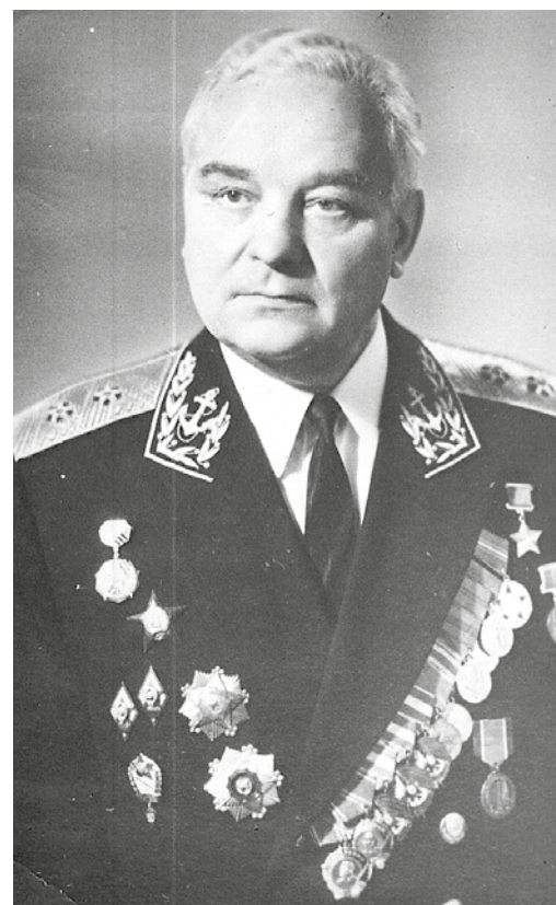
Герой Советского Союза Лев Пантелеев, 1970-е годы.

Он – кавалер высших наград КНР – орденов «Государственного Знамени» 1-й и 2-й степеней. На-