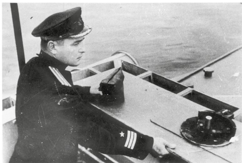
Герой Советского Союза капитан 3 ранга Л.Н. Пантелеев на торпедном катере. Тихоокеанский флот, 1945 год