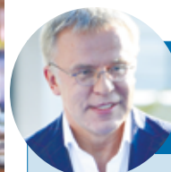
Вячеслав Фетисов, депутат Государственной думы РФ

– Хотелось бы сказать слова благодарности поисковикам, всем людям, которые на протяжении десятилетий хранили и приумножали память о великом подвиге великих людей. Это ещё один ответ тем нашим недоброжелателям, которые стараются переписать историю. У них это не получится. Светлая память об этом беспрецедентном подвиге будет вечно жить в наших сердцах.