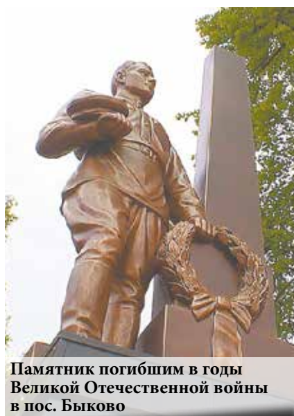
Памятник погибшим в годы Великой Отечественной войны в пос. Быково