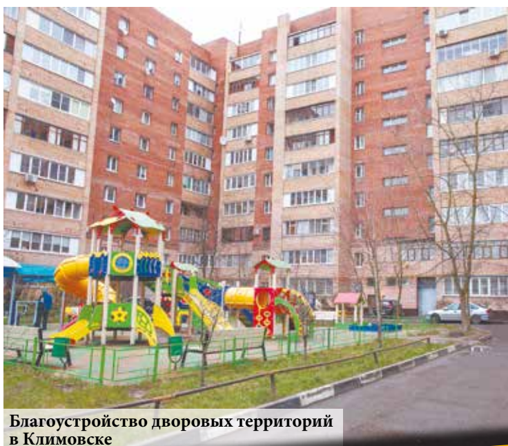
Благоустройство дворовых территорий в Климовске

Остается вопрос несанкционированного складирования мусора на территории бывшей воинской части в деревне