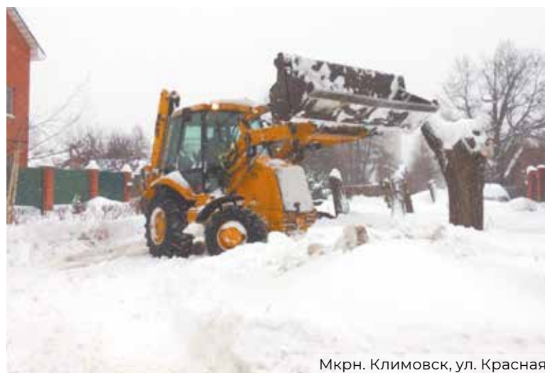
Мкрн. Климовск, ул. Красная

В микрорайоне Кузнечики уборка снега осуществлялась 9-ю управляющими организациями, были задействованы 4 трактора, 4 бензиновых снегоуборщика и 78 человек.