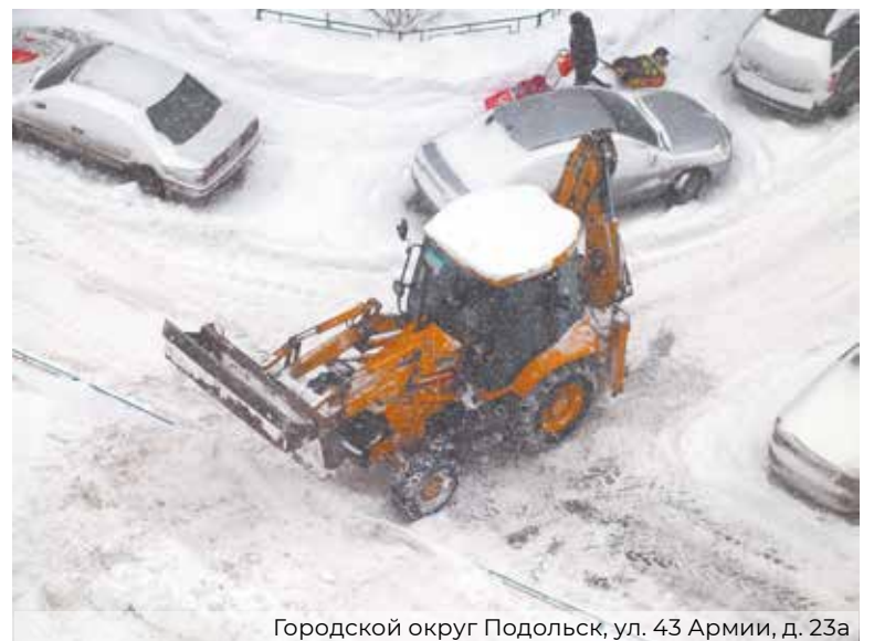
Городской округ Подольск, ул. 43 Армии, д. 23а

ные недостатки были переданы подрядным организациям для устранения. Усилены работы по уборке территорий, прилегающих к промышленным объектам и объектам потребительского рынка.