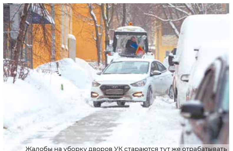
Жалобы на уборку дворов УК стараются тут же отрабатывать