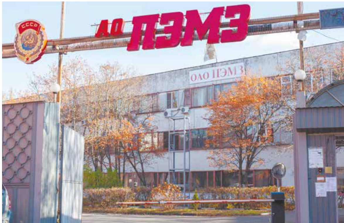
Завод ожидает 100-летия...

Разворовать и «пустить под откос» или спасти и возродить?