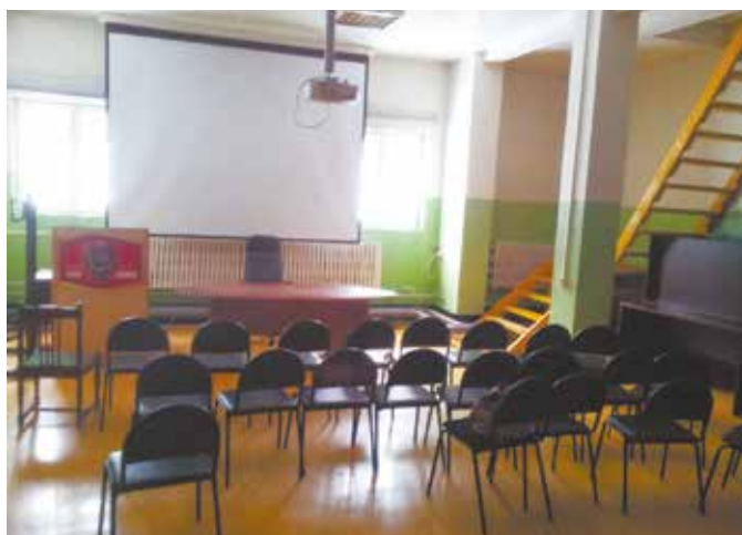
Здесь проходило собрание акционеров

Вместе с тем действующий Совет вправе не только принять, но и не принять такие заявления о самоотводе, особенно учитывая то, что все они уже официальным порядком включены в список кандидатов в Со-