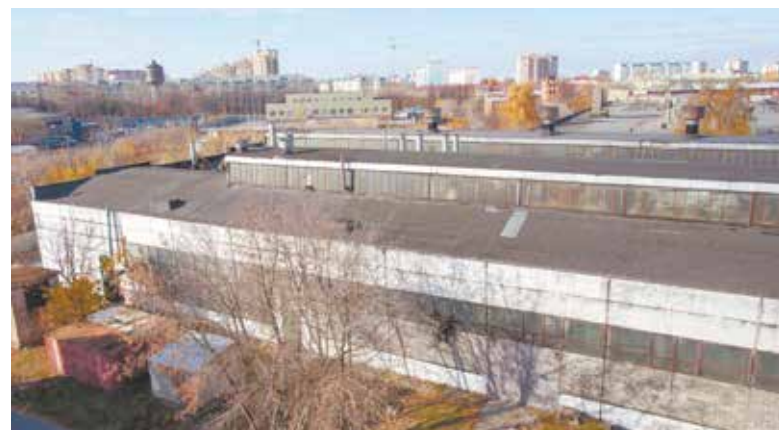
Цеха завода ещё стоят...