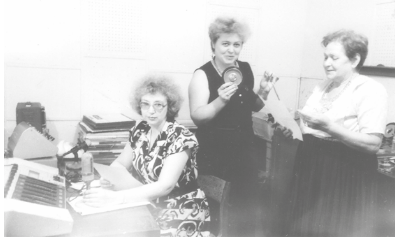
Подольское радио в 80-е годы

Алла Егорова