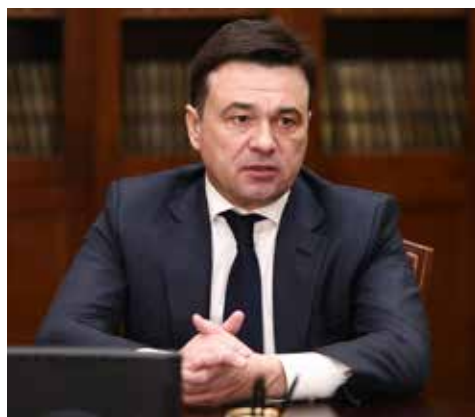
Губернатор Московской области Андрей Воробьев подписал постановление №171-ПГ от 02.04.2020 об усилении мер по борьбе с коронавирусом