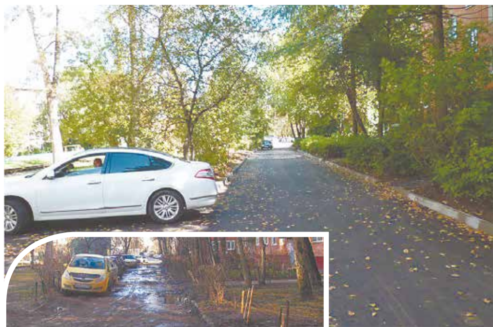
Проспект 50 лет Октября, 26

Всегда интересно наблюдать, как твой родной город растет и развивается. В микрорайоне Климовск Городского округа Подольск, конечно, как и везде, есть свои плюсы и минусы, но большинство жителей считает, что в последние четыре года позитивных изменений и достижений прибавилось