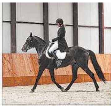
Верховая езда в Подмосковье Подольск, Конно-спортивный клуб «Престиж»