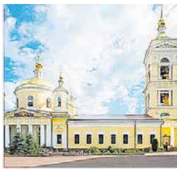
Главный храм Подольска Подольск, Троицкий собор

С помощью туристического портала «Добро пожаловать в Подмосковье» ( http://welcome.mosreg.ru ) жители Большого Подольска смогут познакомиться не только с интересными местами и маршрутами в Московской области, но и узнать много нового. Так, на сайте портала размещается информация о культурно-исторических объектах, усадьбах, храмах и театрах. Здесь можно почитать не только о самых интересных и красивых местах Подмосковья, но и ознакомиться с культурными и спортивными событиями, которые пройдут в ближайшее время в Московской области.