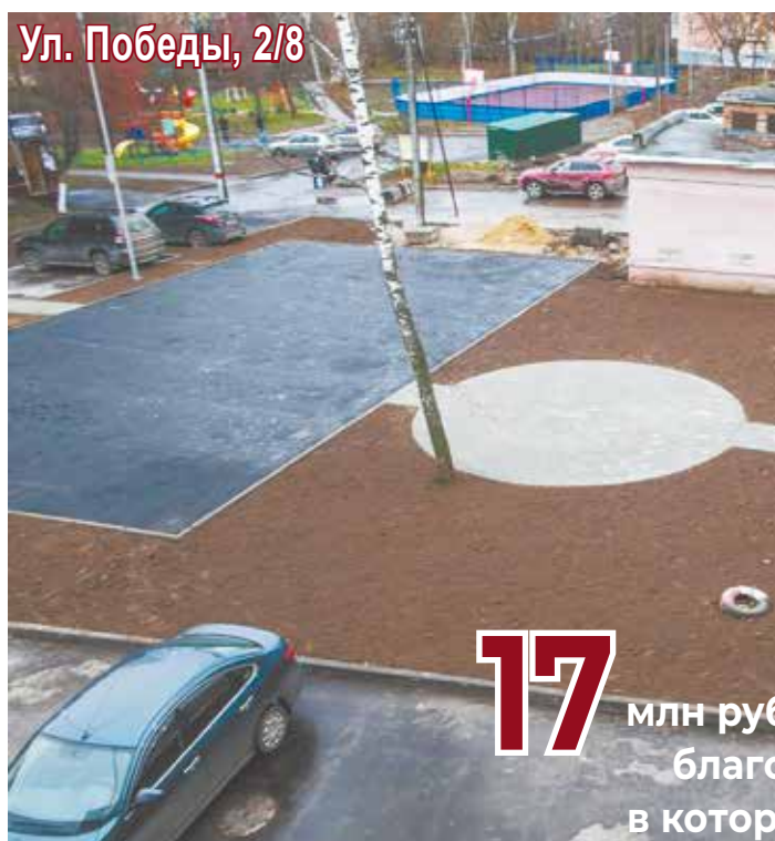
Ул. Победы, 2/8

В чем суть нашего предложения? Началось с того, что я наткнулся на заметку о можжевельнике и узнал, что это реликтовое растение со сроком жизни более 1000 лет благотворно влияет на улучшение экологии и очищает воздух той территории, где растет. Так было решено по периметру нашего двора высадить