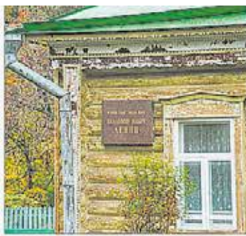
Бывший мемориальный дом-музей Ленина на берегу Пахры Подольск, Музей-заповедник «Подольск»