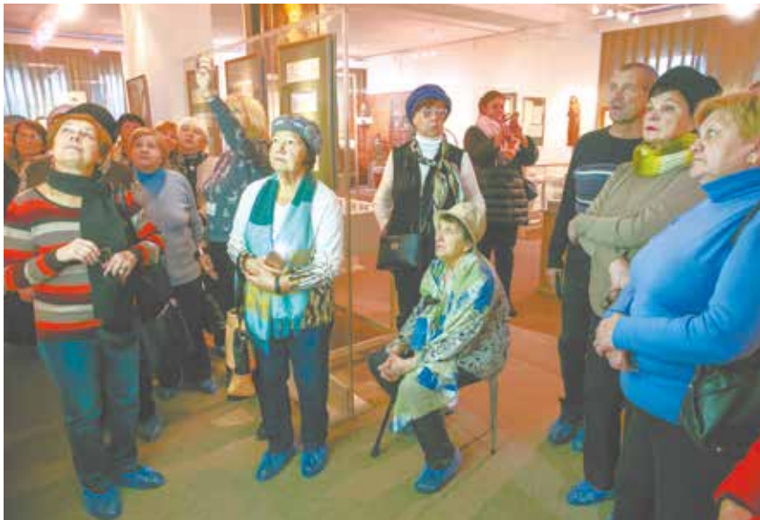
Туристическая группа из Сергиева Посада посетила музей «Подолье»

Узнать расписание, маршрут и условия конкретной поездки можно, оставив заявку в мобильном приложении «Соц-услуги» или обратившись в Подольское управление социальной защиты населения по адресу: Подольск, ул. Литейная, 6/8, тел.: 8 (4967) 54-64-02, 8 (4967) 54-17-01. В Климовское управление социальной защиты по адресу: микрорайон Климовск, ул. Ленина, 27, телефон горячей линии: 8-915-048-12-53.