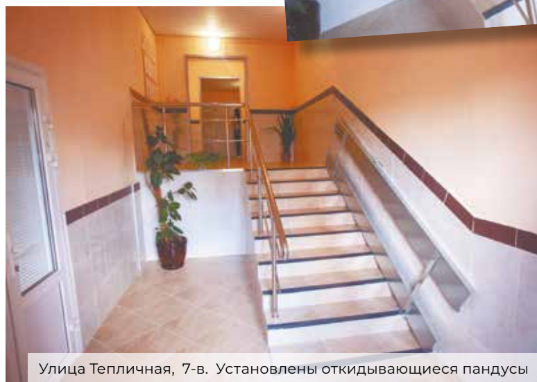
Улица Тепличная, 7-в. Установлены откидывающиеся пандусы