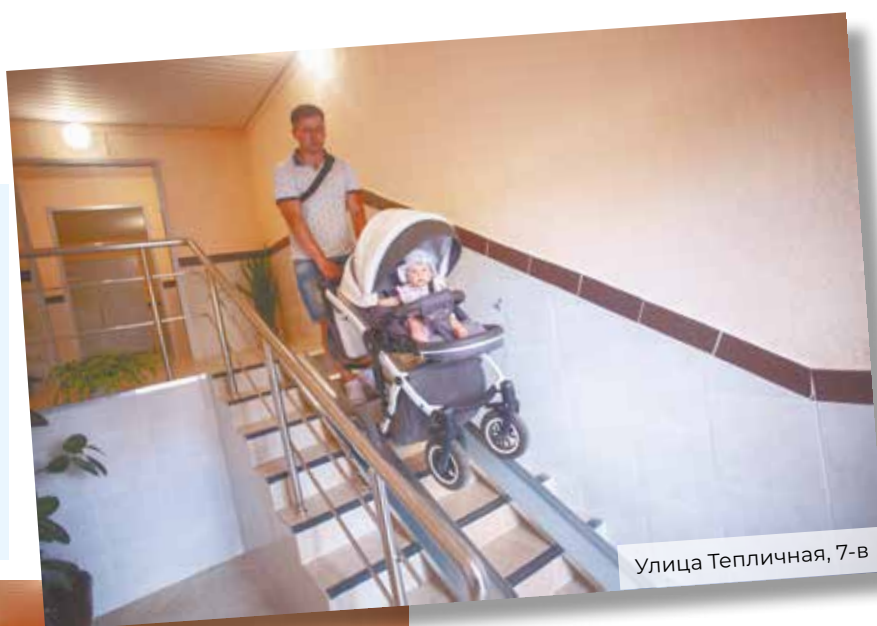
Улица Тепличная, 7-в

33% подъездов по Губернаторской программе «Мой подъезд» должны быть готовы к 1 июля 2019 года. По прогнозам, озвученным на оперативном совещании председателем Комитета по ЖКХ администрации Ильей Скомороховым, к этому сроку может полностью выполнить годовой план ООО «ПИК-комфорт», завершив ремонты в 7 подъездах обслуживаемых многоквартирных домах. Продолжат наращивать темп работ ООО «Антей +», завершающее работы в 9 подъездах (90 % от годового плана), МУЖРП № 4 (70 подъездов и 80,5%), МУП «ДЕЗ» (54 подъезда и 64,3 %), МУЖРП №1 (33 подъезда