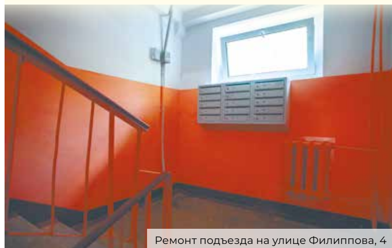
Ремонт подъезда на улице Филиппова, 4