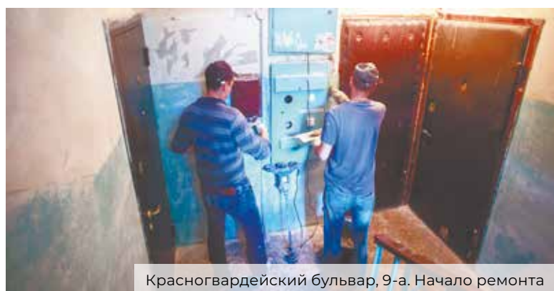
Красногвардейский бульвар, 9-а. Начало ремонта

– Живу здесь 34 года, и это первый ремонт подъезда на моей памяти. Рабочие все сделали отлично: шпаклевали, красили, все время советовались с жителями, как лучше сделать, чтобы нам понравилось. Всем большое спасибо!