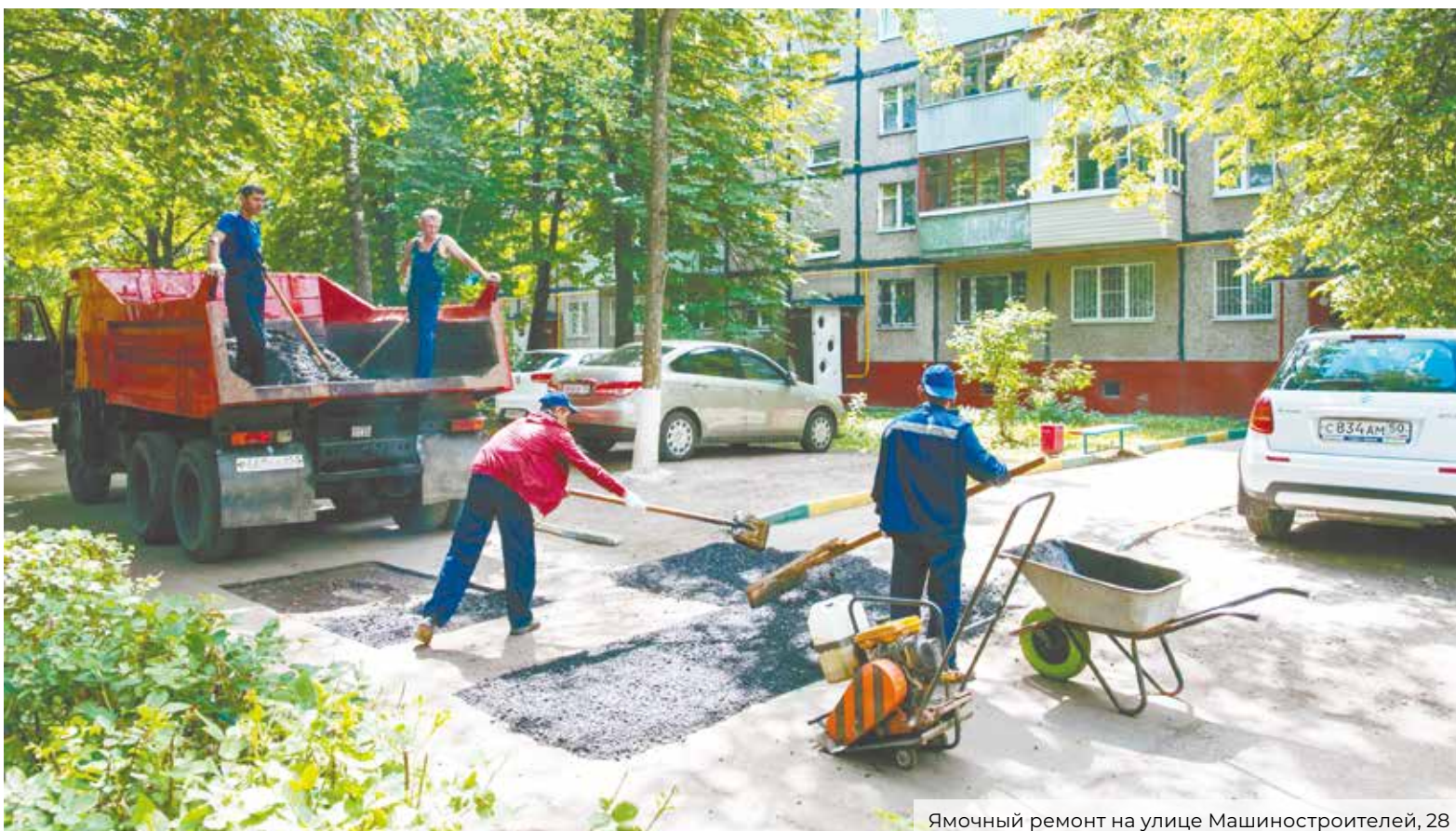
Ямочный ремонт на улице Машиностроителей, 28