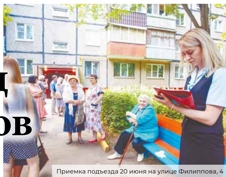
Приемка подъезда 20 июня на улице Филиппова, 4

сумма бюджетных субсидий – 47,5 %. Из них доля Московской области – 75,8 %, доля Городского округа Подольск – 24,2 %. Остальные 52,5 % – это внебюджетные источники (управляющие компании).