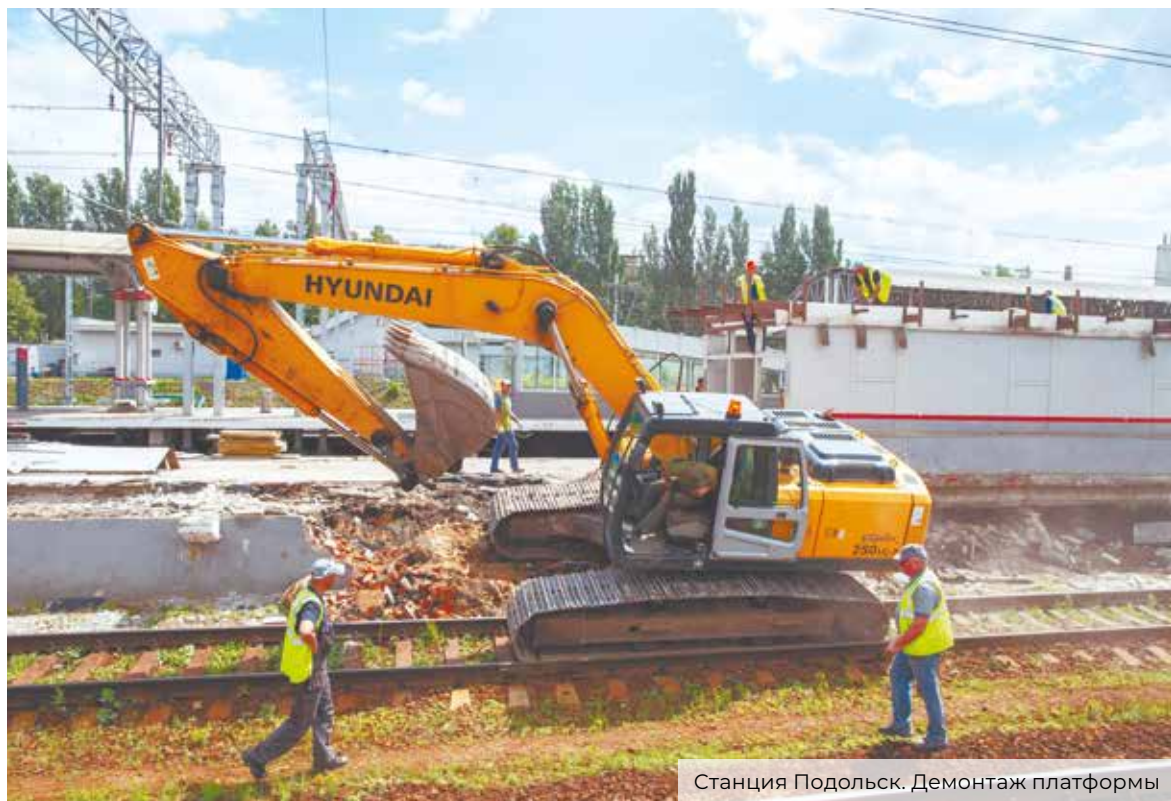
Станция Подольск. Демонтаж платформы

– Какие результаты по озеленению и устройству клумб, урн?