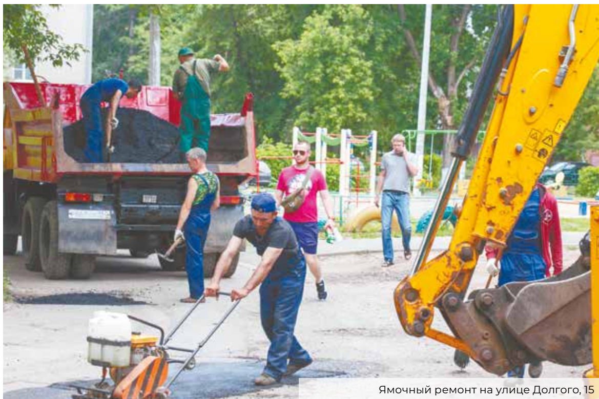
Ямочный ремонт на улице Долгого, 15

В Климовске – пять, в Подольске, Дубровицком и Стрелковском – по девять, Лаговском – семь, Львовском – две.