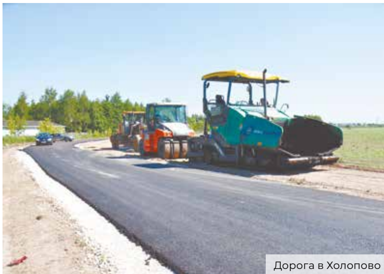
Дорога в Холопово

Интервью вела Людмила Степанова