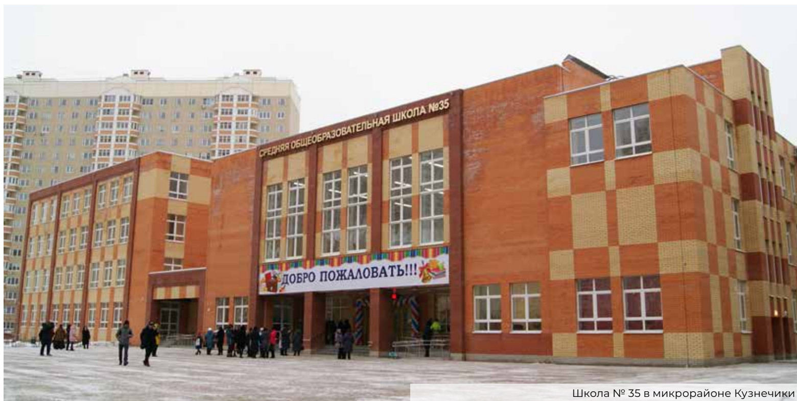
Школа № 35 в микрорайоне Кузнечики