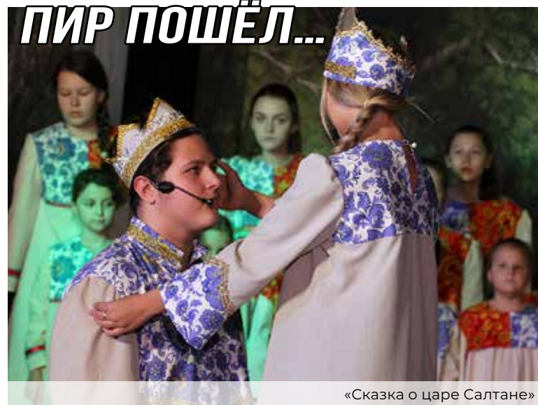
«Сказка о царе Салтане»

Великолепная музыка, талантливая режиссура Ирины Базаровой и блестящая, искромётная игра юных артистов были высоко оценены профессиональным жюри. В итоге спектакль удостоен кубка и диплома лауреата 1-й степени. Это первая награда премьерного спектакля, который сегодня с успехом идёт на сценах Подольска.