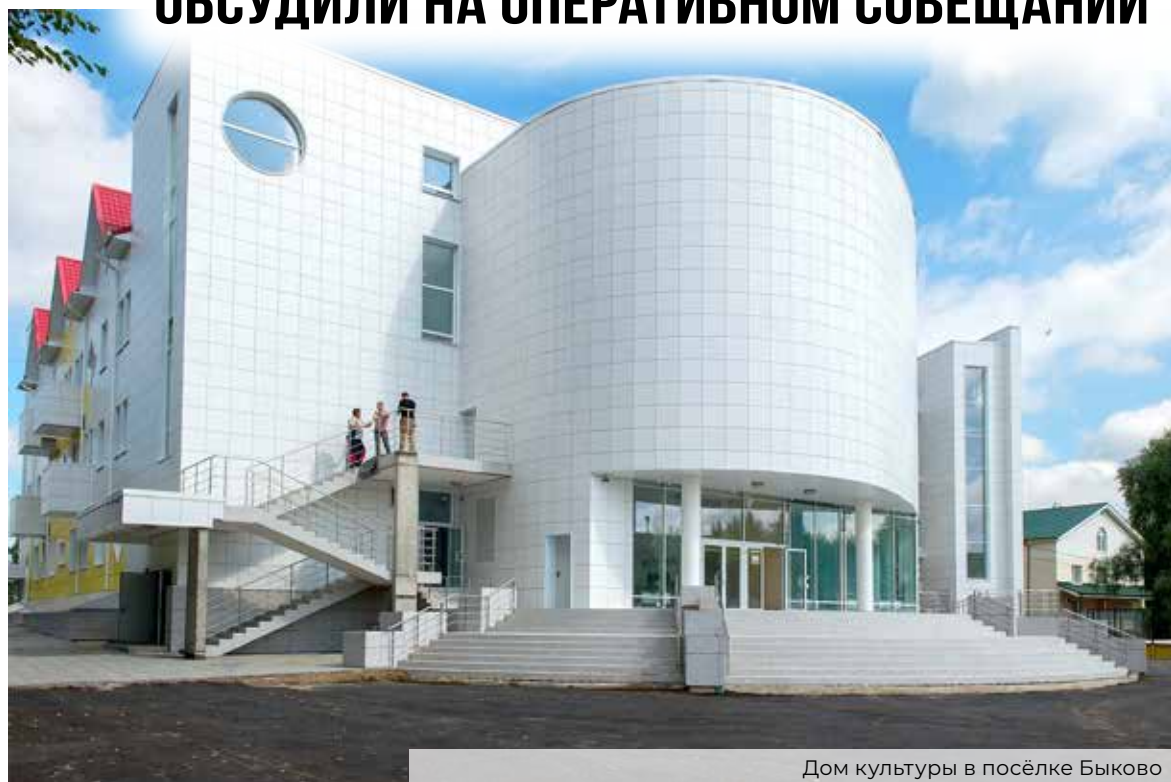
Дом культуры в посёлке Быково